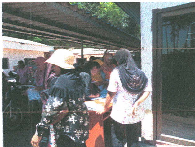
ผู้เข้าร่วมลงทะเบียน