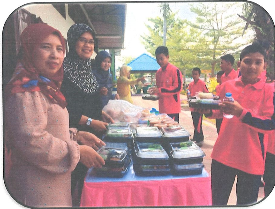
นักเรียนรับอาหารกลางวันและเครื่องดื่ม