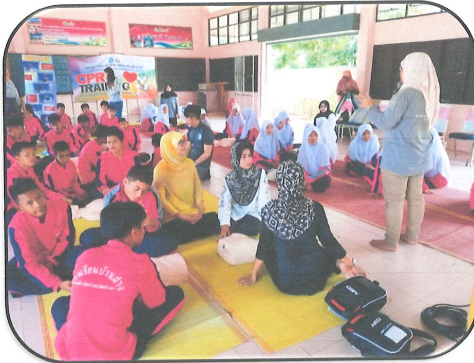
วิทยากรอธิบาย สาธิตการทำ CPR