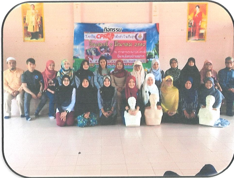
ร่วมถ่ายรูปกับคุณครูและวิทยากร