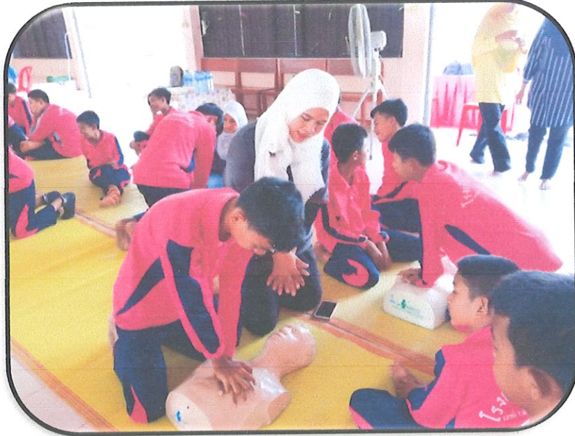
นักเรียนร่วมกันทำกิจกรรม