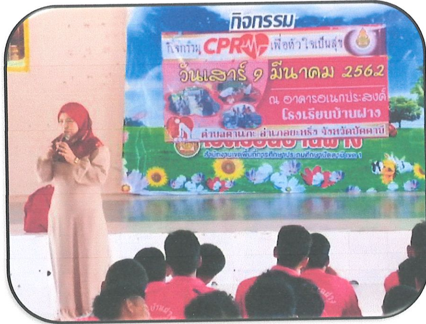
ประธานในพิธีเปิดงาน