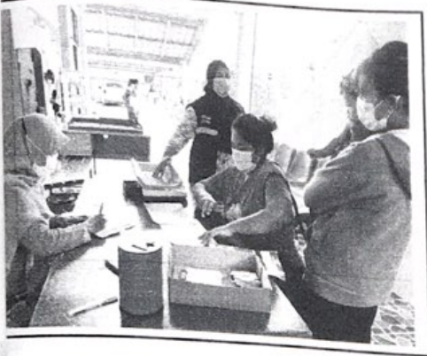
กิจกรรมที่ ๒.๒ ชั่งน้ำหนัก วัดส่วนสูง เจาะ HCT ในเด็ก