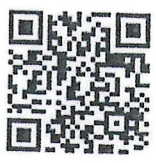
เอกสารแนบ