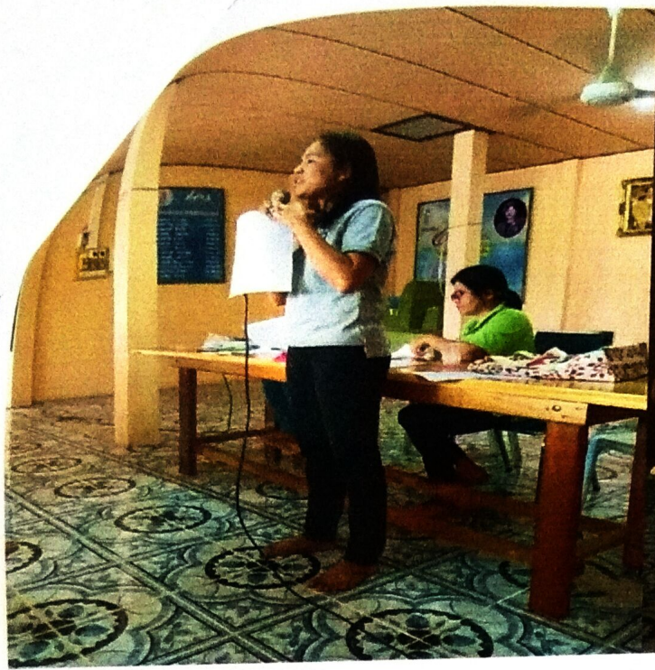
โครงการหยุด ๒ มะเร็งร้าย ภัยใกล้ตัวผู้หญิง เฝ้าระวังมะเร็งปากมดลูก เต้านม (Cancer warning)