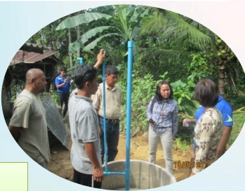
ติดตามการผลิต บ่อแก๊สชีวภาพ