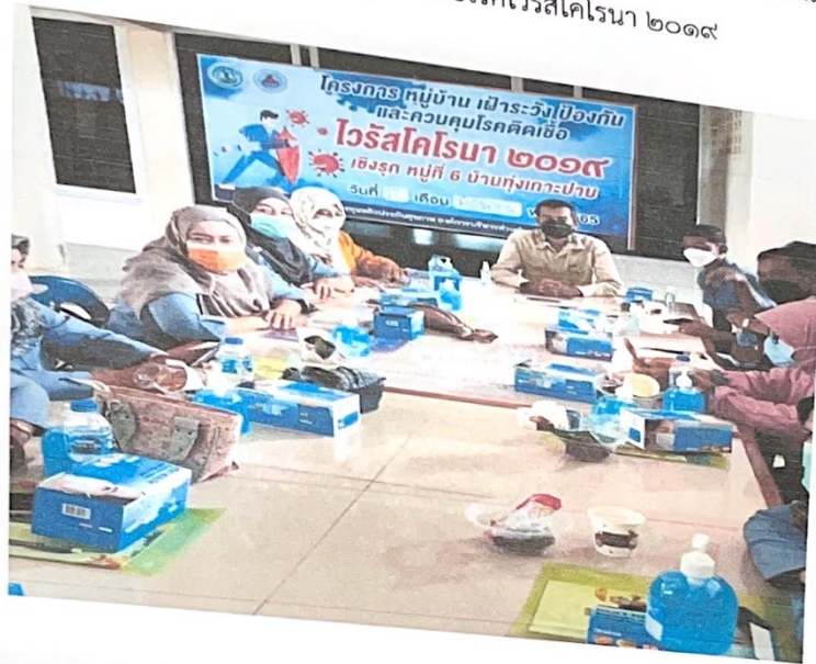
ร่วมอบรมกับอาสาสมัครสาธารณสุขหมู่บ้าน และวิทยากรจาก โรงพยาบาลส่งเสริมสุขภาพ ตำบลเขาขาว ให้ความรู้เกี่ยวกับโรคไวรัสโคโรนา ๒๐๑๙