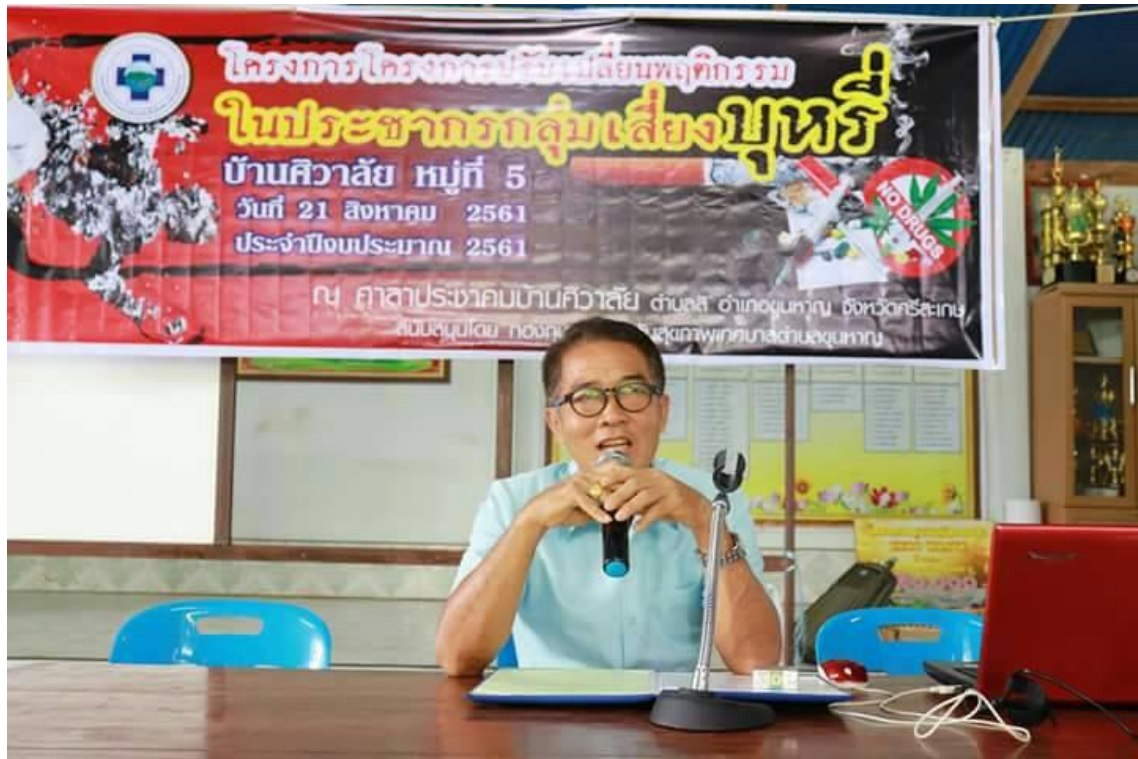
ภาพโครงการปรับเปลี่ยนพฤติกรรมในประชากรกลุ่มเสี่ยงบุหรี่