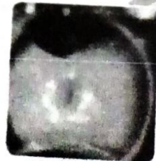
4 months after หลังจี้เย็น 4 เดือน