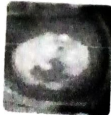
Large, thick, dull acetowhite lesion ก่อนการจี้เย็น