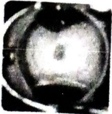
Nulliparous ไม่เคยคลอดบุตร