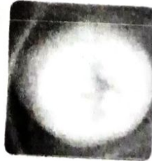
Immediately after หลังการจี้เย็นทันที