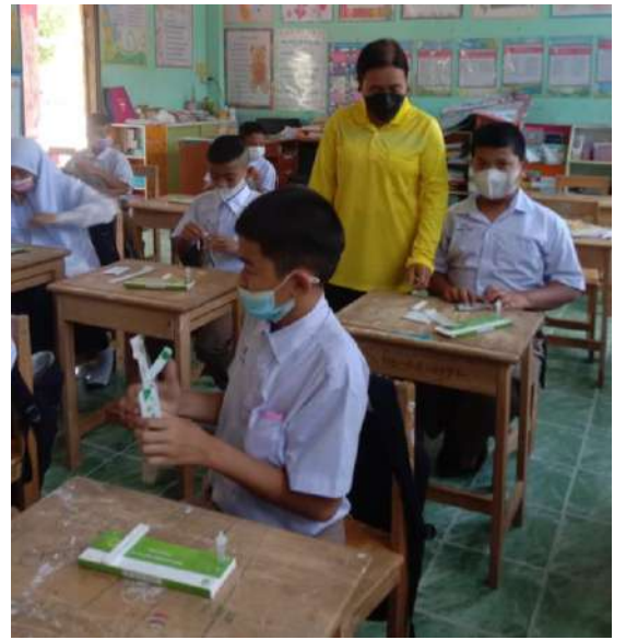
นักเรียนชั้นประถมศึกษาปีที่ 6 สามารถใช้ชุดตรวจ ATK ตรวจสอบด้วยตนเอง หลังจากครูสอนวิธีการตรวจ