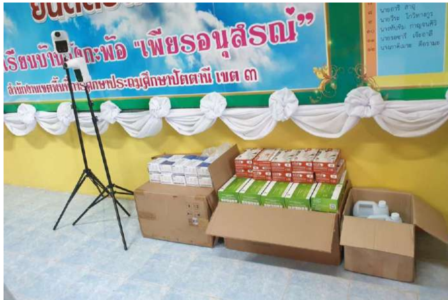
โรงเรียนได้ดำเนินการจัดซื้อวัสดุสำหรับการคัดกรองและการป้องกันการติดเชื้อไวรัสโคโรนา (Covid -19)