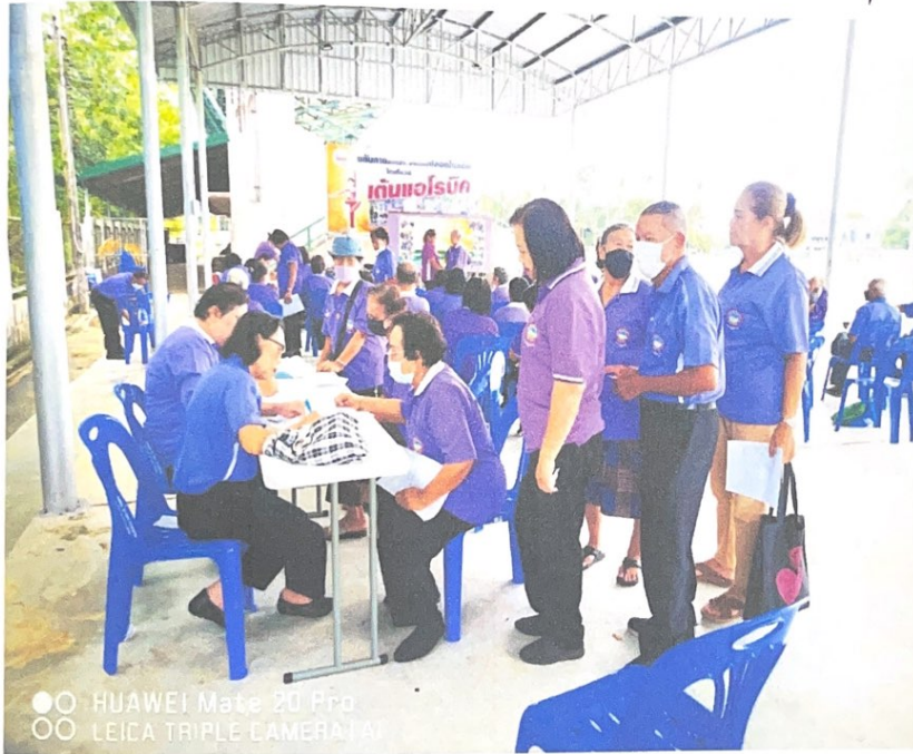
ตรวจสุขภาพเบื้องต้นและลงทะเบียน