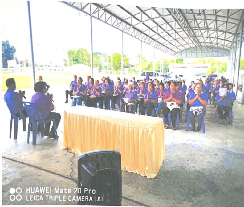
สมาคม สัตวแพทย์