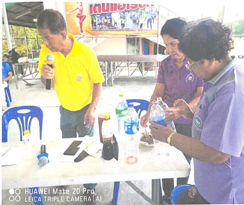
วิทยากร ให้คณาจารย์ " สื่อ แวดล้อม กับคุณภาพชีวิตที่ดี "