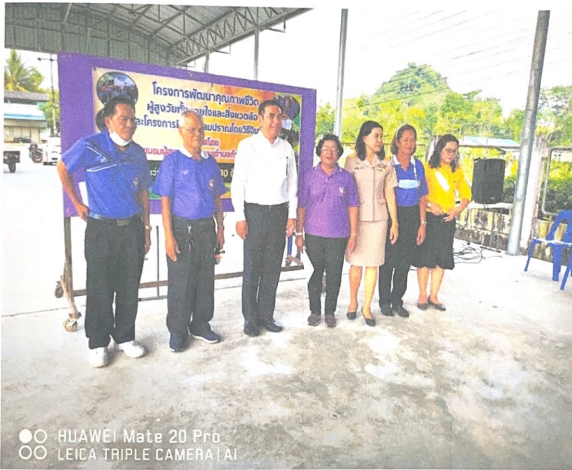
●○ HUAWEI Mate 20 Pro ●○ LEICA TRIPLE CAMERA | AI