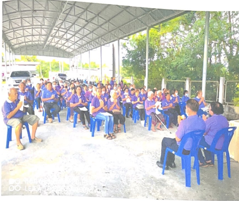
สมาชิก สอตมขต และส่งมอบ ก่อนทำกิจกรรมทุกครั้งที่