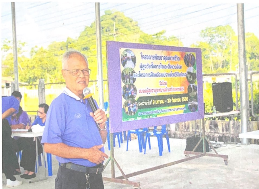
ประธานชมรมฯ กล่าวรายงาน