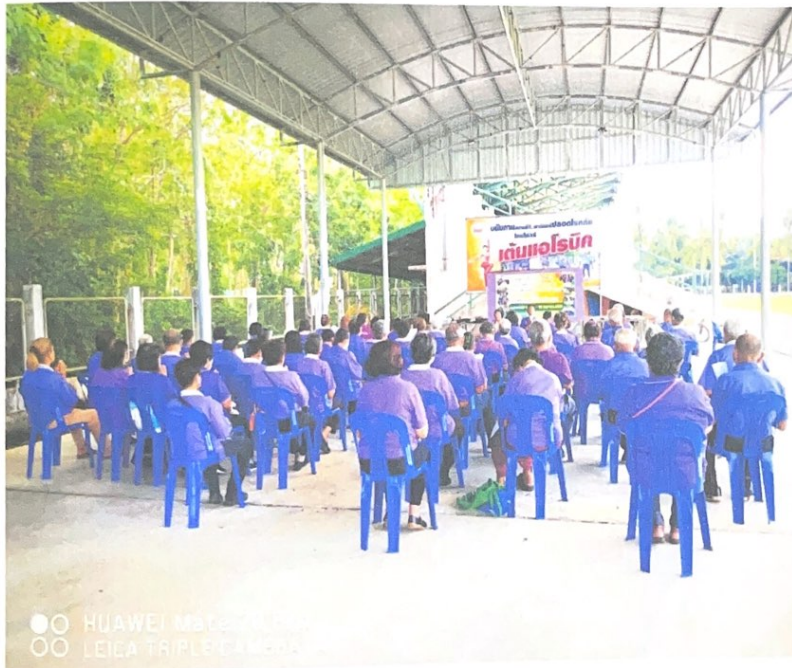
ให้คนมารู้ เกี่ยวกับการกินที่ถูกหลักอนามัย