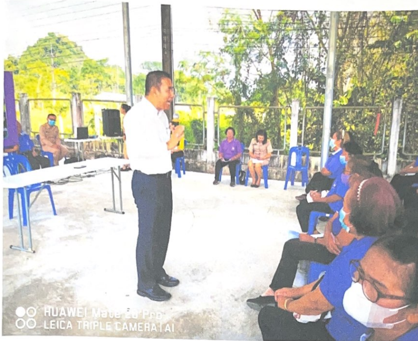
●○ HUAWEI Mate 20 Pro ●○ LEICA TRIPLE CAMERA | AI