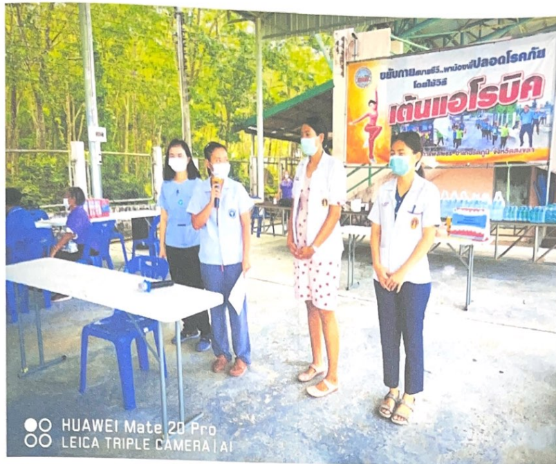
หม่อมพัน จาก ร.พ. รังสิตภูมิ ให้ความสุข