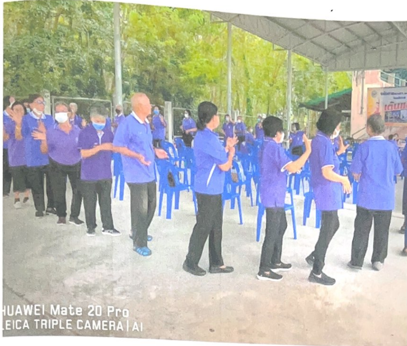
พัฒนาอารมณ์ โดยการเคลื่อนไหวแบบช้าลง