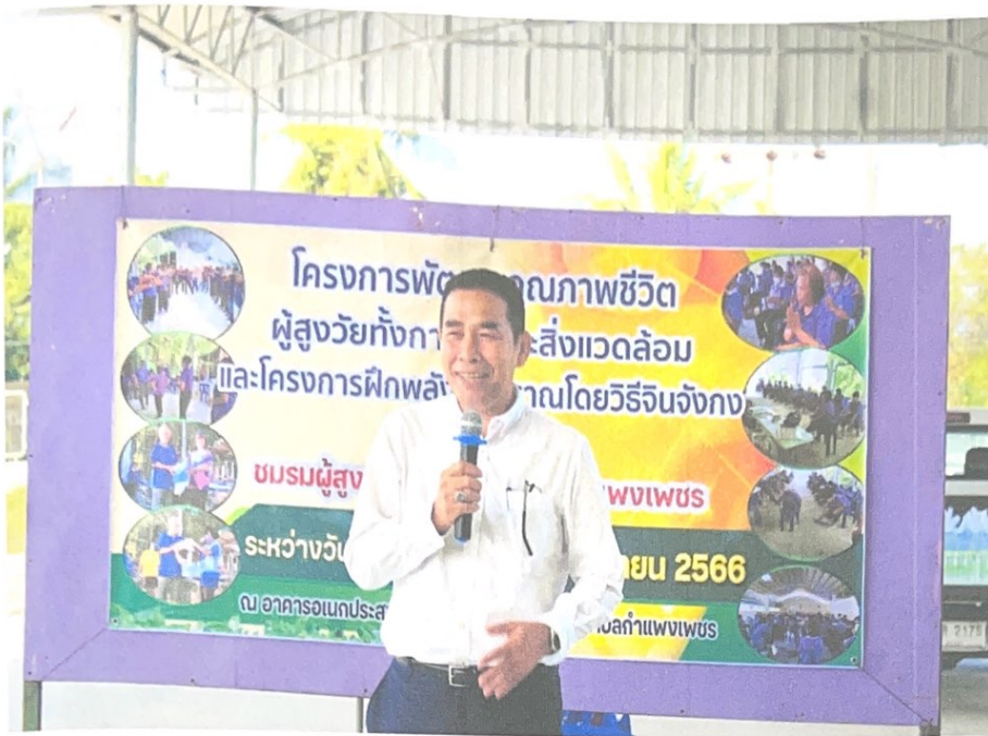
ประธานกล่าวเปิด