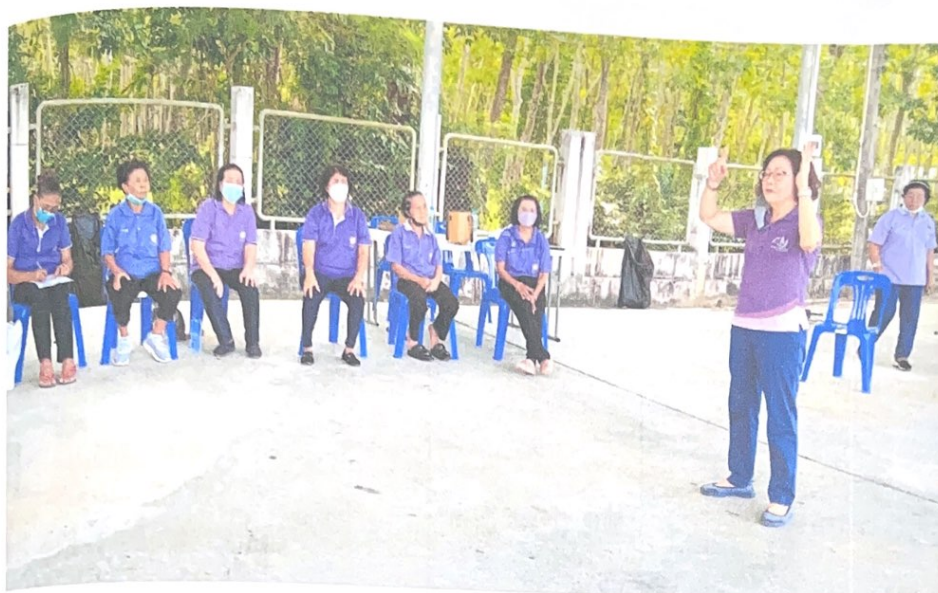
วิทยากร ให้ความรู้ " การเฝ้าระวังโรคซึมเศร้าในผู้สูงอายุ "