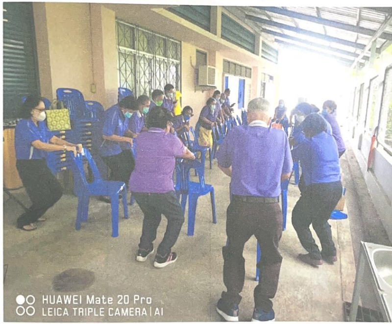
สันทนาการ สลับการให้ความสุข