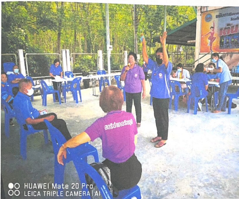
ท่าเซ็ง เป็นการผสมของโดยใช้มือประกอบ