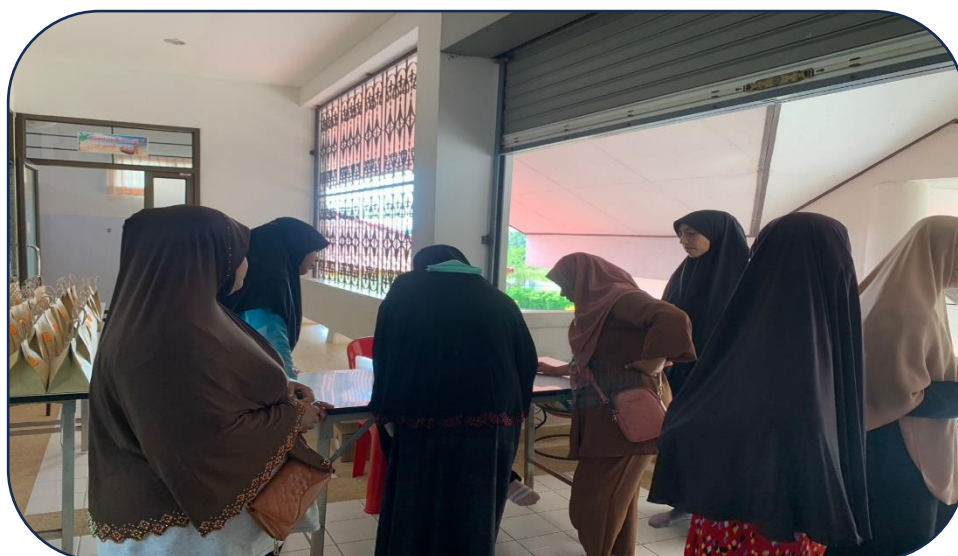
อบรมให้ความรู้วันที่ ๑