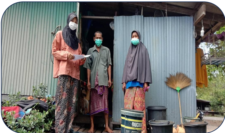
คัดกรองกลุ่มเสี่ยงโควิด