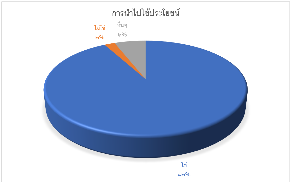
ภาพที่ ๑.๑ แผนภูมิแสดงผลการคัดกรองวัณโรค

จากตารางที่ ๑.๕ พบว่าผู้เข้าร่วมโครงการสามารถนำความรู้ไปใช้ประโยชน์ โดยตอบว่า ใช่ ร้อยละ ๙๒