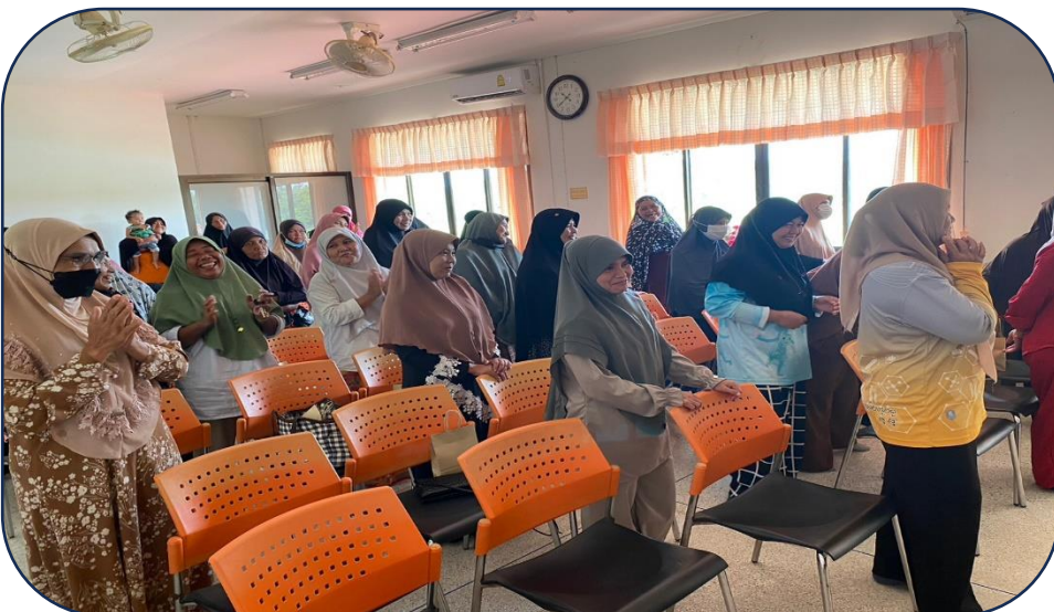
อบรมให้ความรู้วันที่ ๒