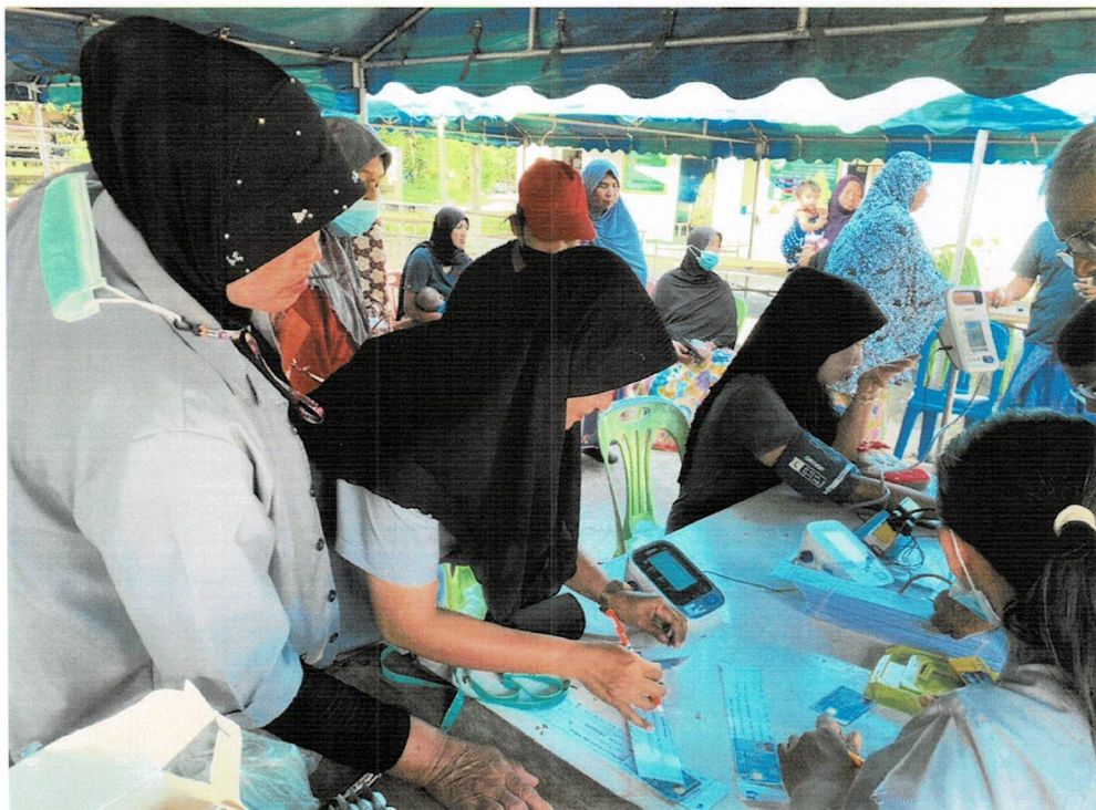
ภาพกิจกรรมประชุมคณะทำงานเพื่อสรุปผลการดำเนินงาน