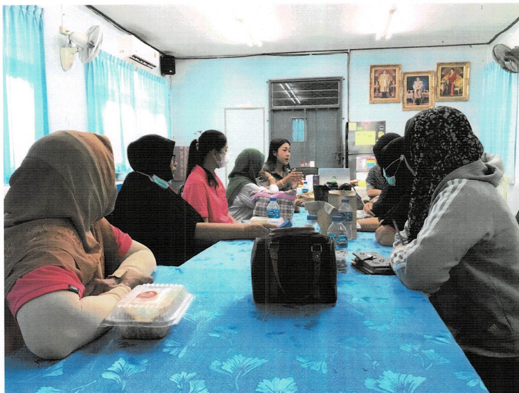
ภาพกิจกรรมการอบรมให้ความรู้ในโครงการ