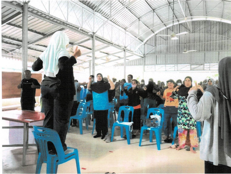
ภาพกิจกรรมการติดตามผลน้ำตาล ความดันโลหิตหลังเข้าร่วมโครงการ และสรุปผลการดำเนินโครงการ