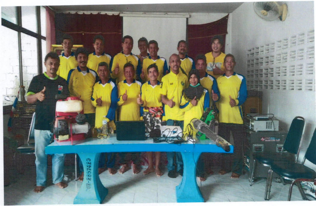
๓.กิจกรรมคว้นในโรงเรียน และบ้านที่เกิดโรคเพื่อการควบคุมตัวแก่ของยุงลาย