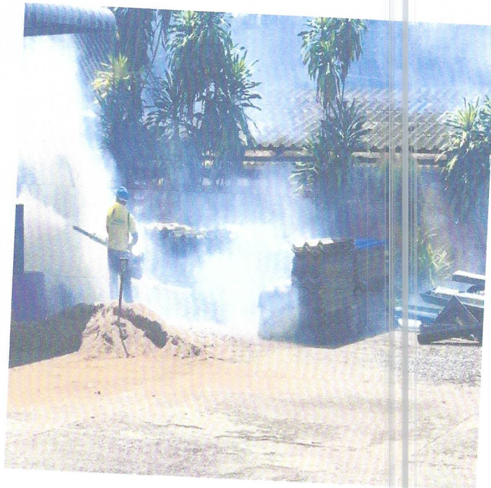
ภาพ กิจกรรมทำความสะอาดภายในโรงเรียนบ้านกุวา เพื่อป้องกันการแพร่กระจายของโรค