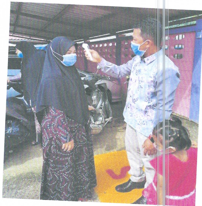
ภาพ มาตรการการคัดกรองก่อนเข้าสถานศึกษา