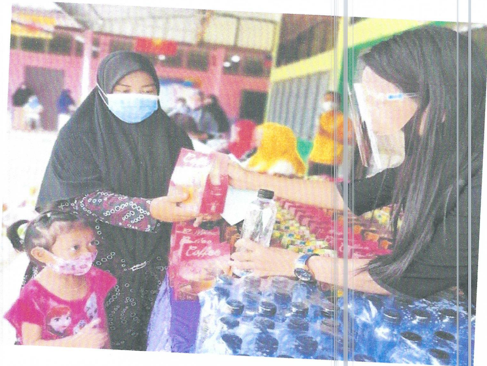
ภาพ กิจกรรมการอบรมให้ความรู้การป้องกันโรคติดเชื้อไวรัสโคโรนา ๒๐๑๙ (COVID -๑๙) สำหรับนักเรียน ผู้ปกครอง ครู และบุคลากรทางการศึกษา