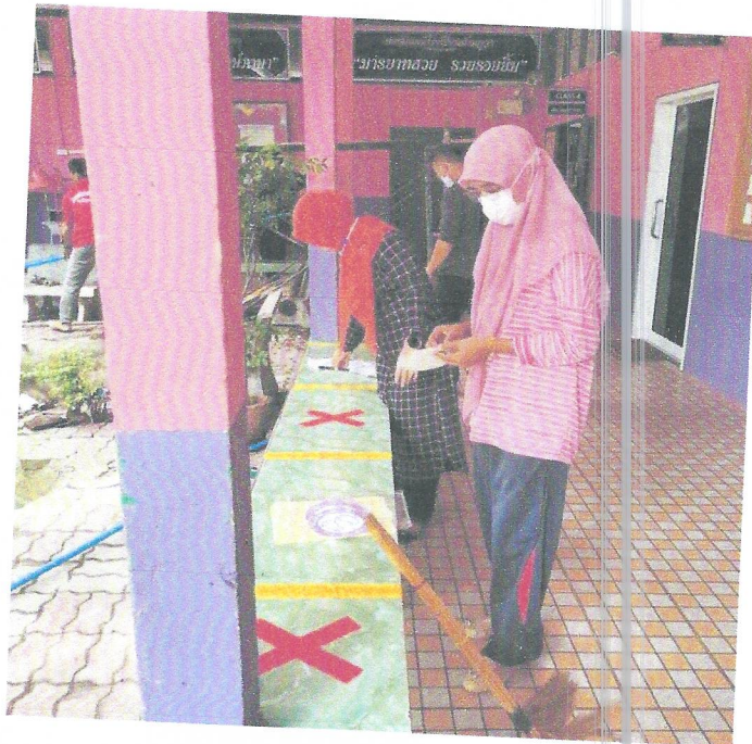
ภาพ ครู และบุคลากรทางการศึกษาโรงเรียนบ้านกุว่าด้าดำเนินการตาม มาตรการโรงเรียนปลอดภัยห่างไกลโควิด-๑๙ (Social Distancing)