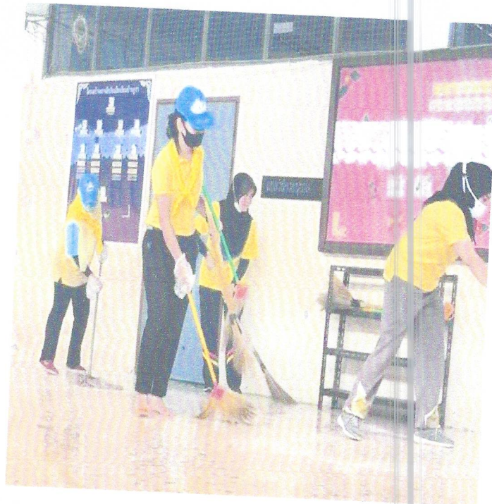
ภาพ กิจกรรมทำความสะอาดภายในโรงเรียนบ้านกุวา เพื่อป้องกันการแพร่กระจายของโรค