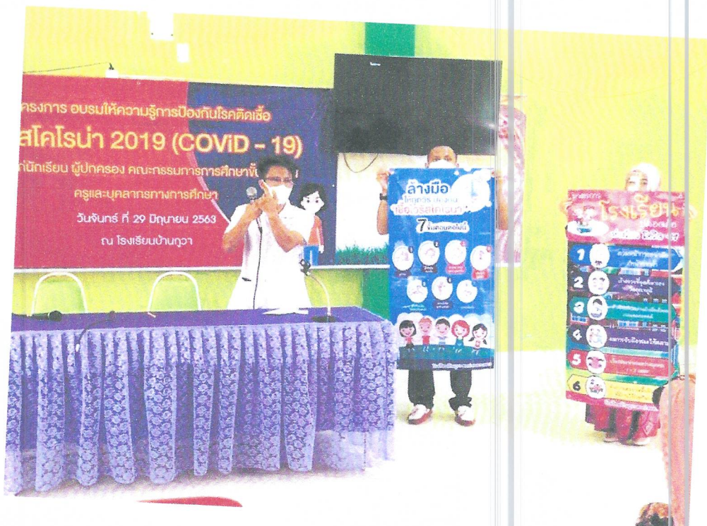
ภาพ กิจกรรมการอบรมให้ความรู้การป้องกันโรคติดเชื้อไวรัสโคโรนา ๒๐๑๙ (COVID-19) สำหรับนักเรียน ผู้ปกครอง ครู และบุคลากรทางการศึกษา