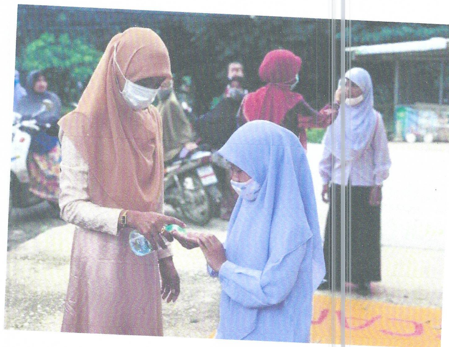
ภาพ โรงเรียนมีมาตรการคัดกรองการวัดไข้ ล้างมือ และสวมหน้ากากอนามัย เพื่อความปลอดภัยจากการลดการแพร่เชื้อโรค