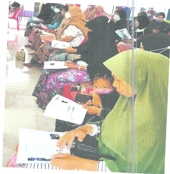
ภาพ กิจกรรมการอบรมให้ความรู้การป้องกันโรคติดเชื้อไวรัสโคโรนา ๒๐๑๙ (COVID -๑๙) สำหรับนักเรียน ผู้ปกครอง ครู และบุคลากรทางการศึกษา