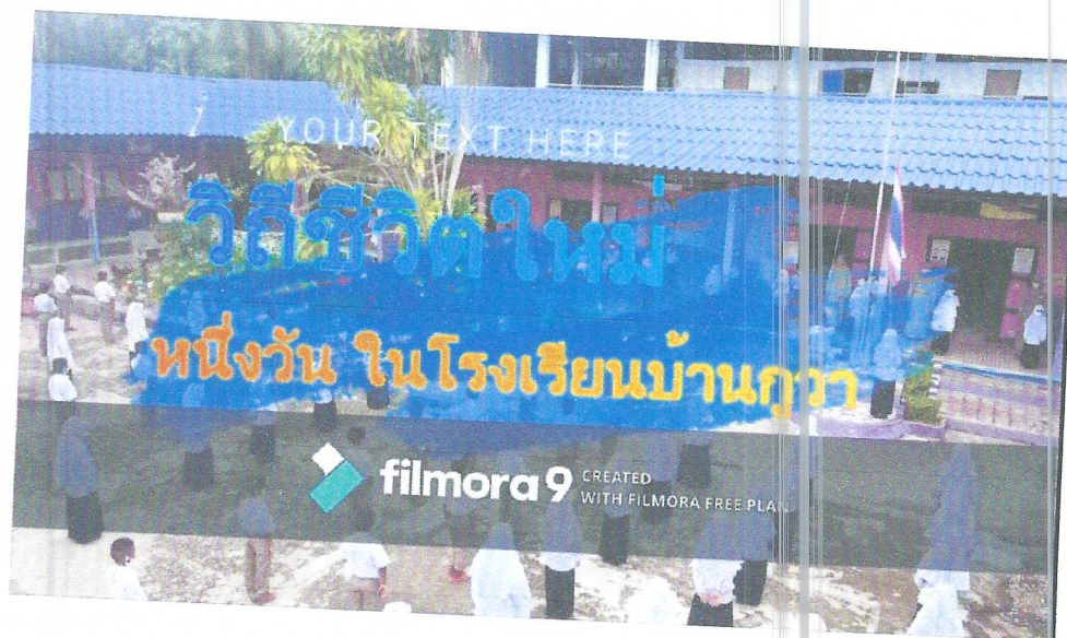
ภาพ โรงเรียนจัดทำคู่มือและวิดีโอ (New Normal After Covid ๑๙ One day In Kuwa) เพื่อเผยแพร่และประชาสัมพันธ์มาตรการของโรงเรียนในการเฝ้าระวัง ป้องกัน โรคติดเชื้อไวรัสโคโรนา ๒๐๑๙ (COVID-๑๙) ให้กับนักเรียนและผู้ปกครอง