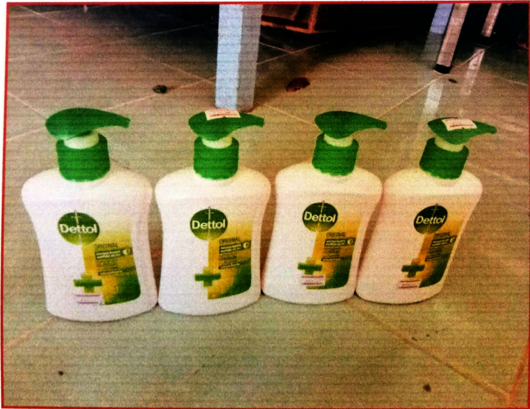
สบู่เหลวล้างมือ ๔ ขวด