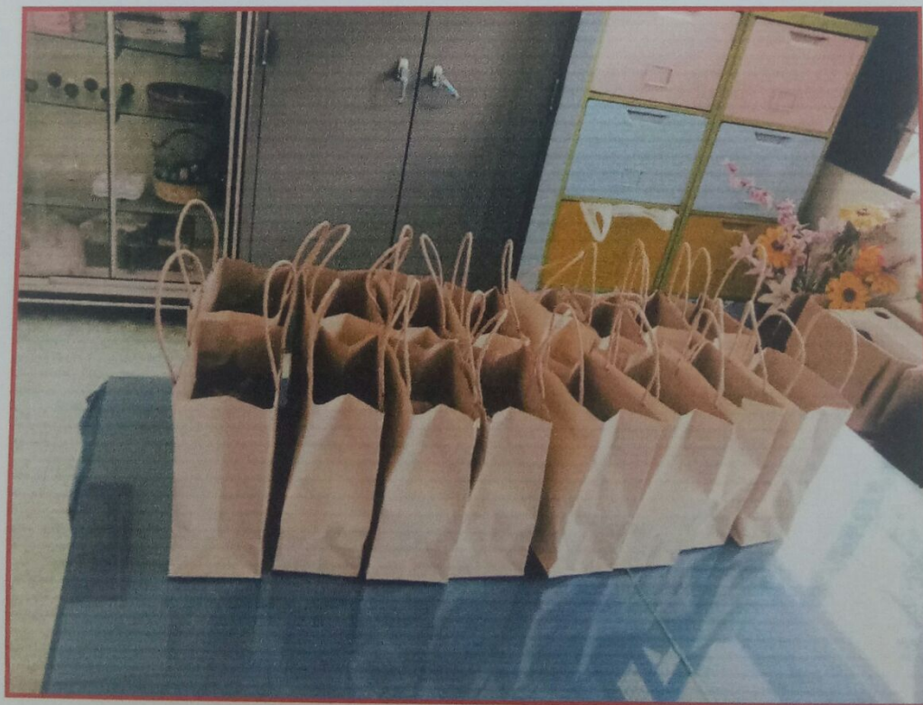
อาหารว่างและเครื่องดื่ม