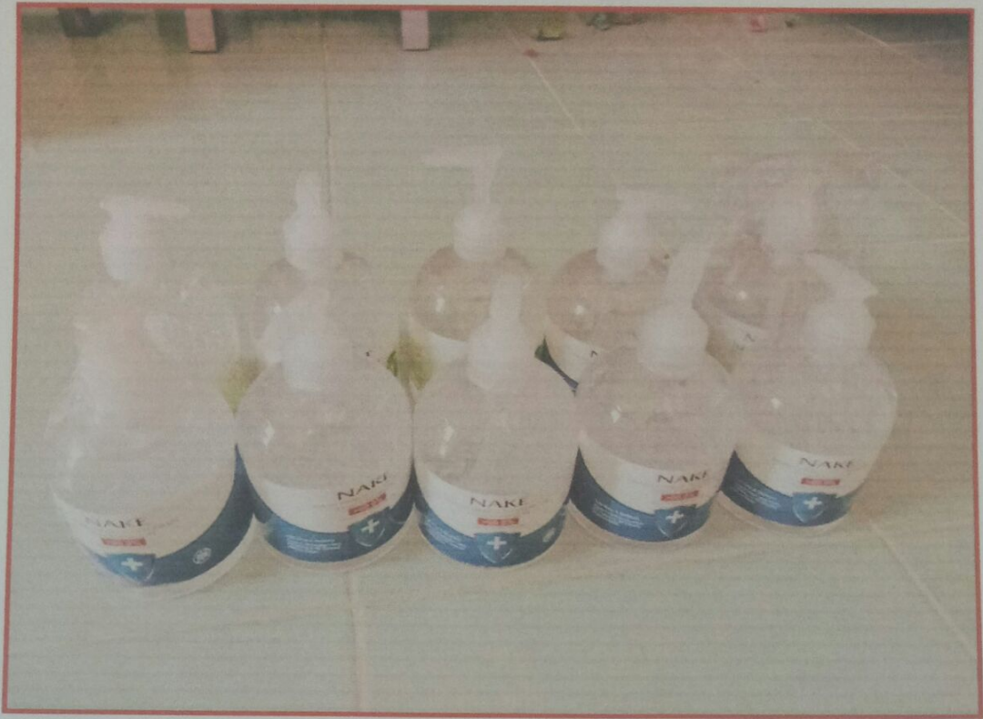
เจลล้างมือแอลกอฮอล์ ๑๐ ขวด