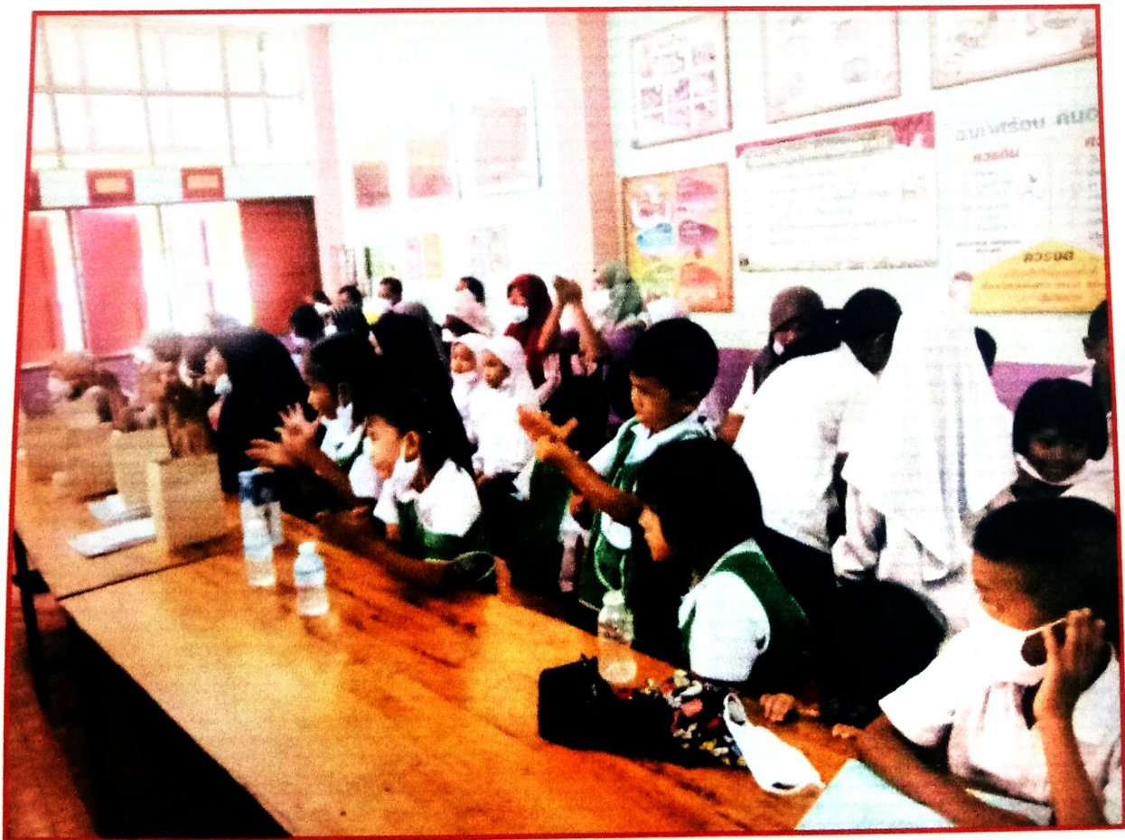
วิทยาการสาธิตวิธีการล้างมือ ๗ ขั้นตอน