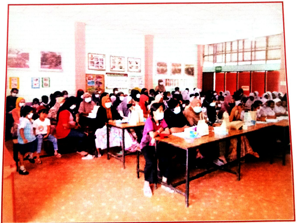
วิทยากรจากโรงพยาบาลส่งเสริมสุขภาพตำบลสะพานไม้แก่น มาให้ความรู้เรื่องการควบคุมและป้องกันโรคติดเชื้อ ไวรัสโคโรนา ๒๐๑๙ (โควิด ๑๙)