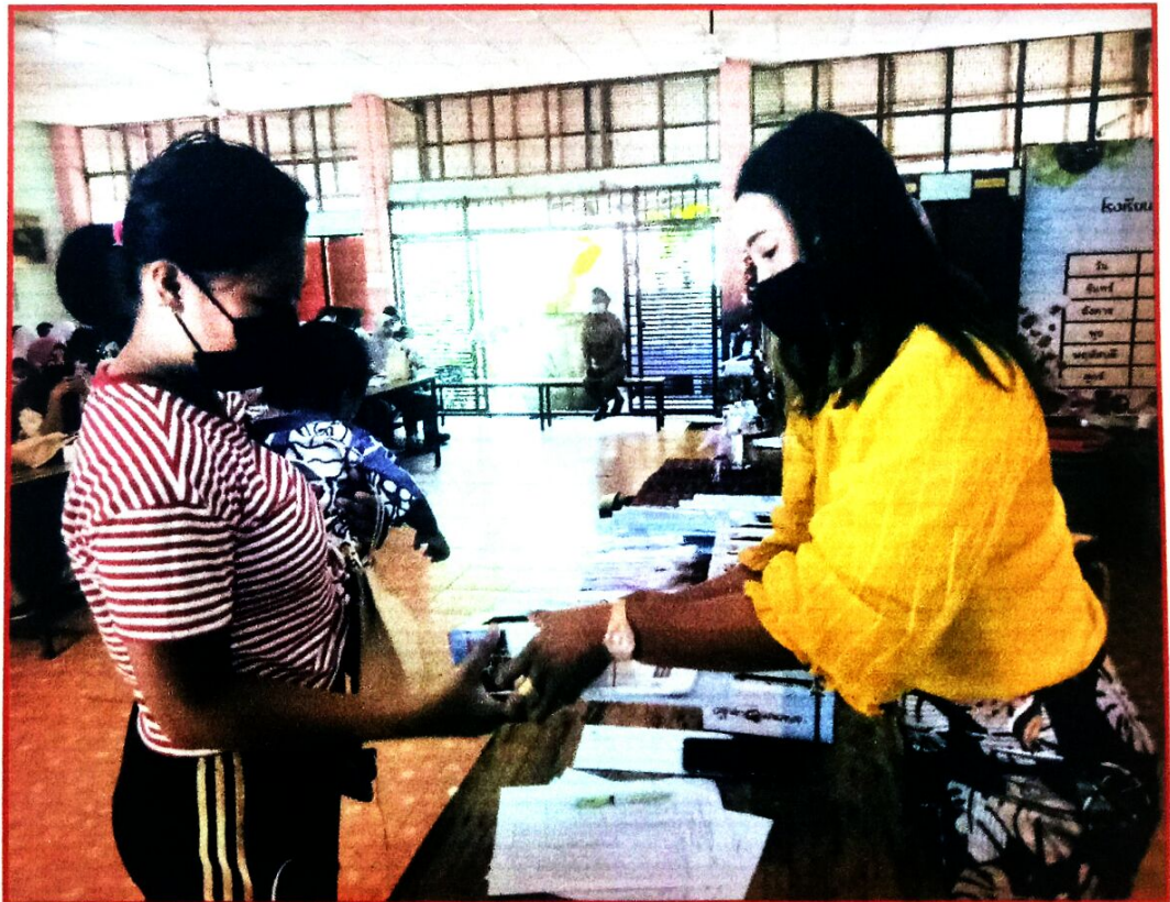
ลงทะเบียนและรับเอกสารการอบรม