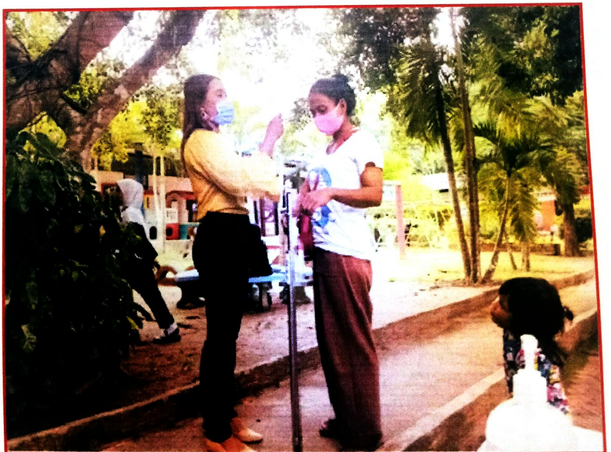
ตรวจวัดอุณหภูมิก่อนเข้ารับการอบรม