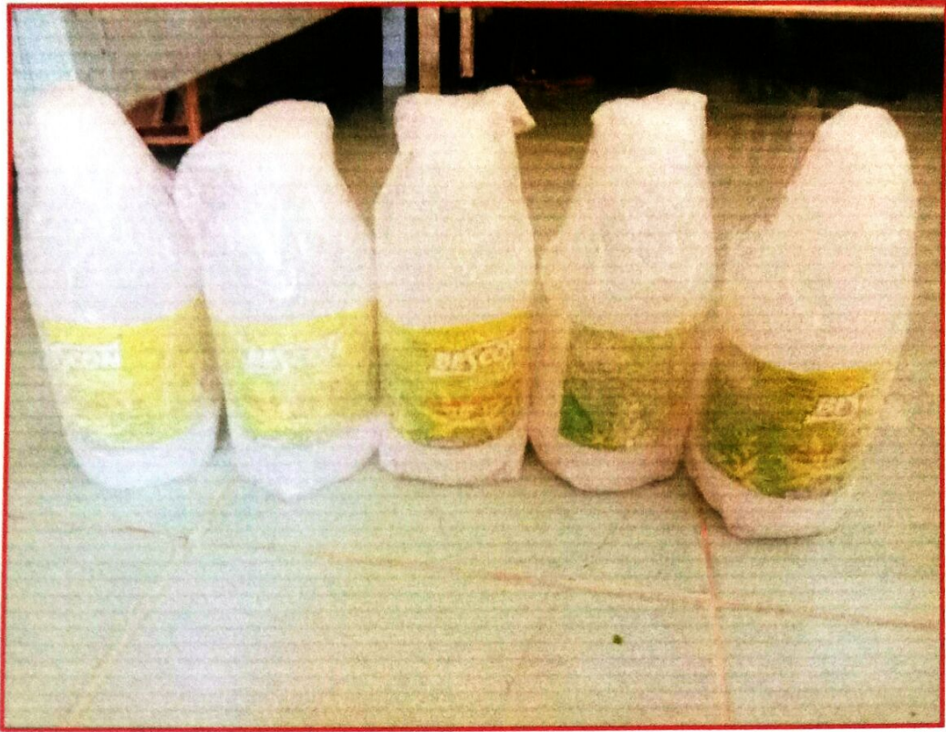
น้ำยาฆ่าเชื้อโรคอเนกประสงค์ ๕ ขวด