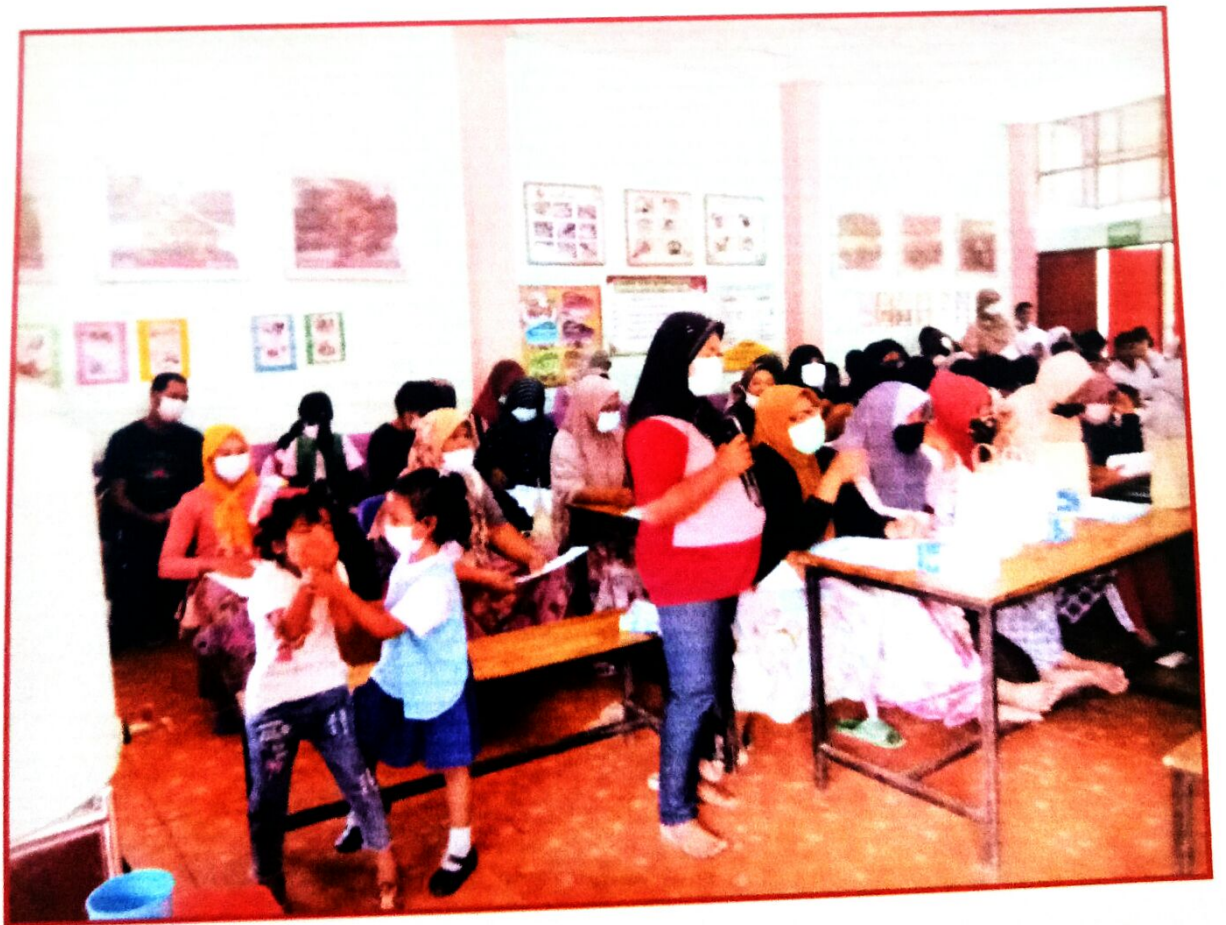
ซักถาม-ตอบคำถาม