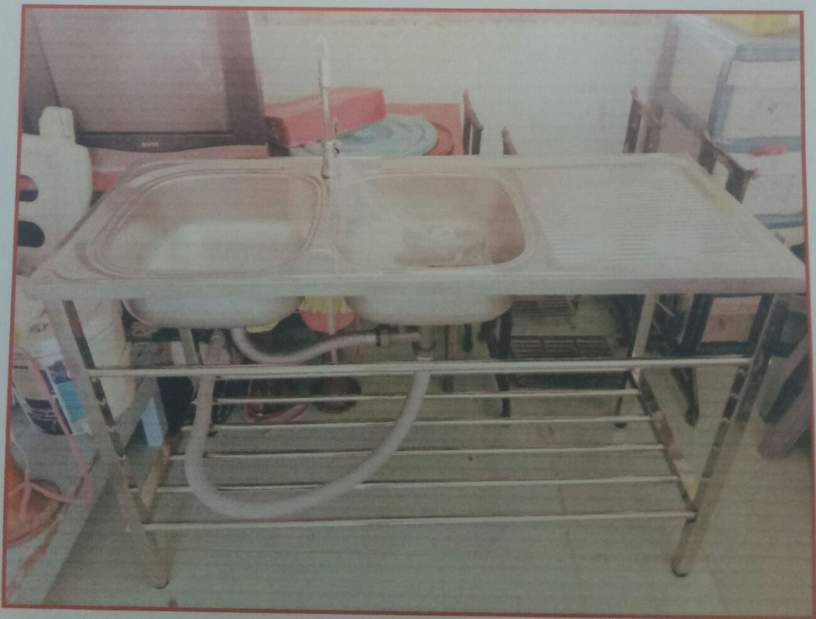
อ่างล้างมือสแตนเลส ๑ ชุด