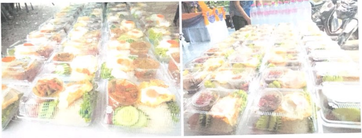
วันที่ ๑ เมษายน พ.ศ. ๒๕๖๔ ข้าวไก่ผัด ๓ สี+ ไข่ดาว+น้ำเปล่า