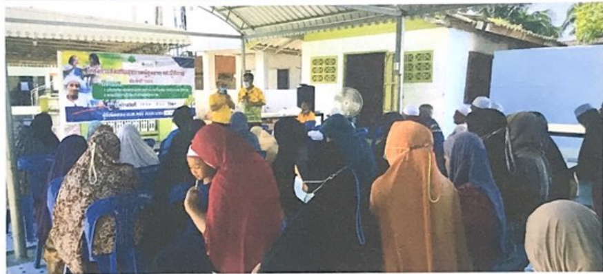
(เยี่ยมผู้สูงอายุ ผู้พิการ ที่ติดบ้าน/ติดเตียง)