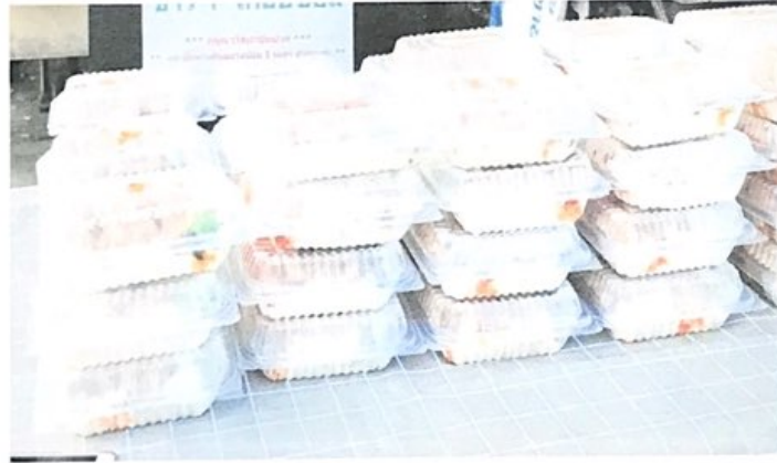
วันที่ ๘ เมษายน พ.ศ. ๒๕๖๔ ข้าวแกงส้มกุ้ง+ไก่ทอดขมิ้น+น้ำเปล่า