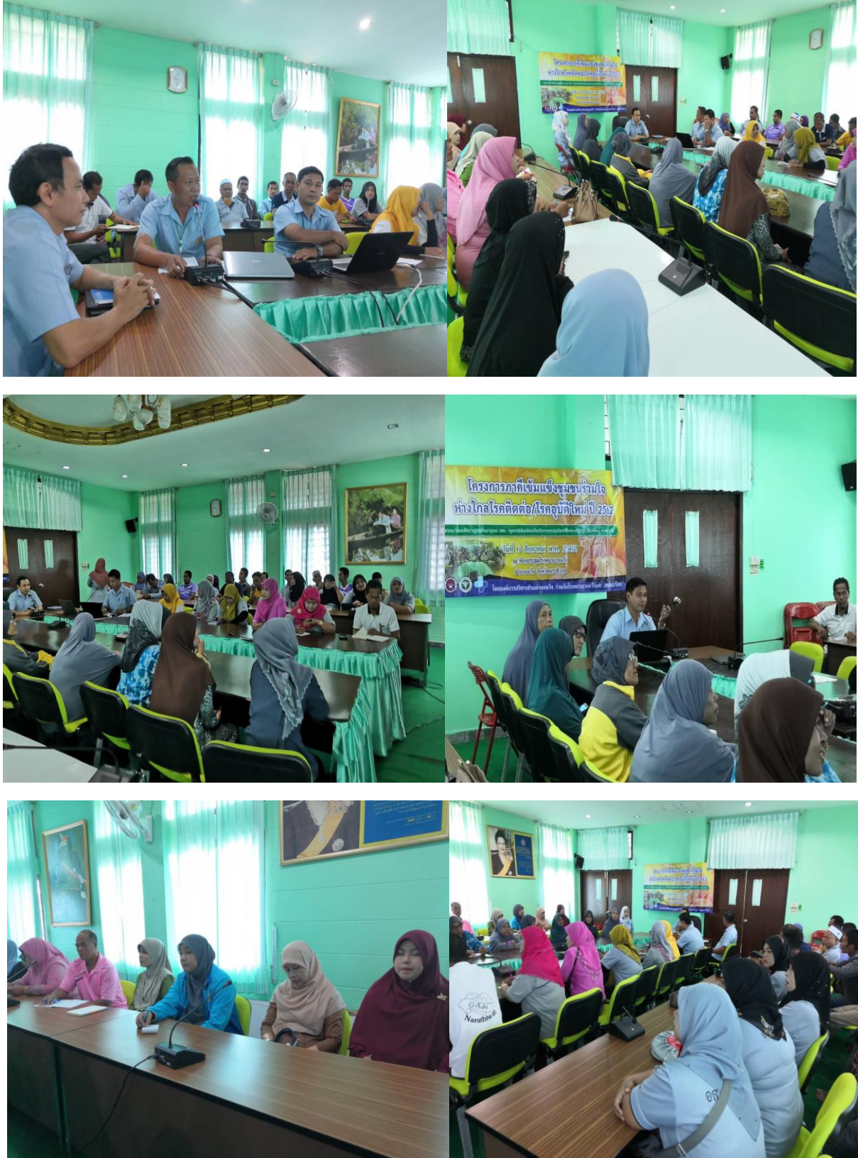
อบรมให้ความรู้เกี่ยวกับการควบคุมป้องกันโรคตามฤดูกาล(ไข้หวัดใหญ่ สุกใส ตาแดง)