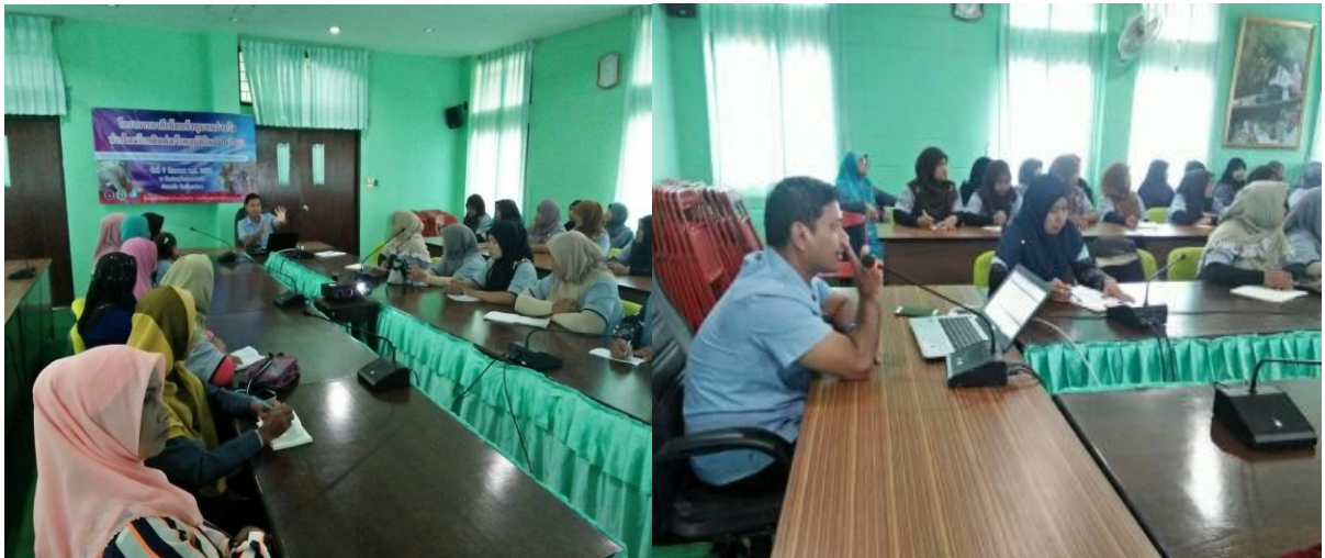
จัดกิจกรรมอบรมให้ความรู้โรคที่ป้องกันได้ด้วยวัคซีน