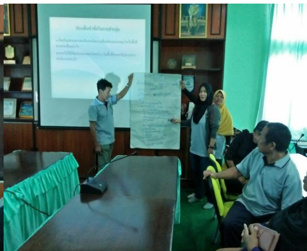
กิจกรรมถอดบทเรียนที่ได้จากการเป็นแกนนำควบคุมโรค