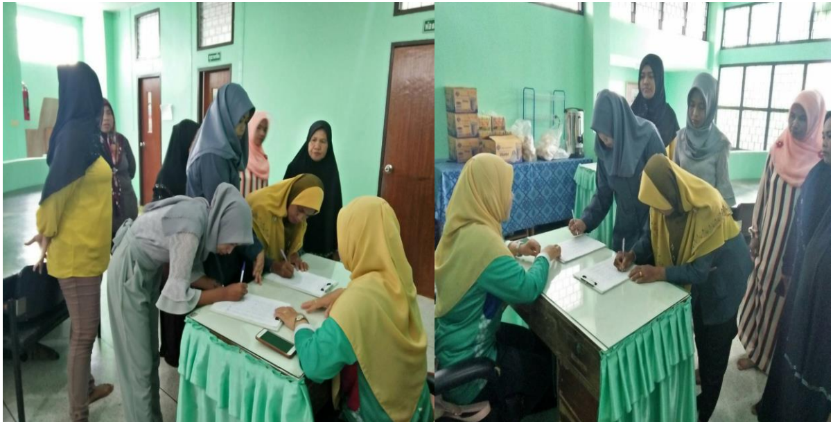
บรรยากาศการลงทะเบียนของผู้เข้าร่วม โครงการฯ