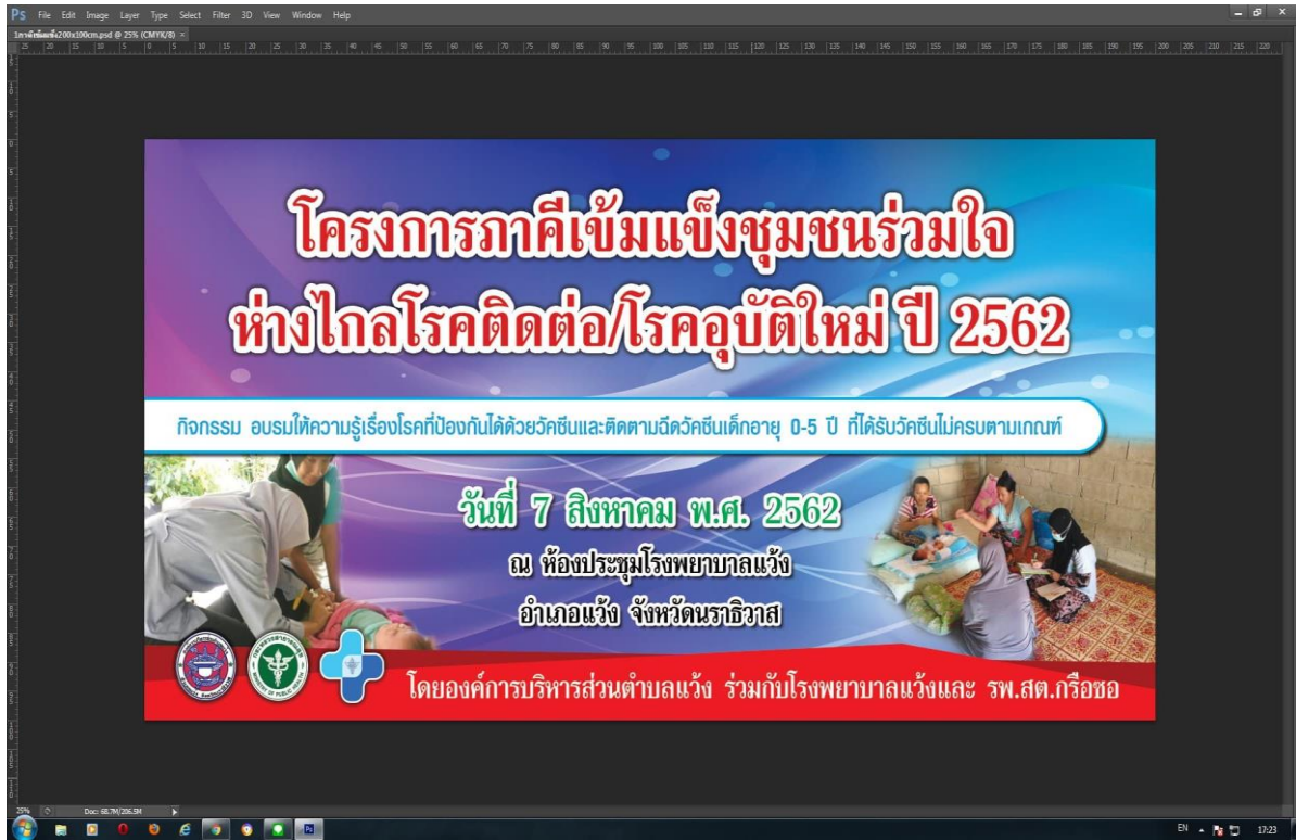
กิจกรรมอบรมให้ความรู้เรื่องโรคที่ป้องกันได้ด้วยวัคซีน