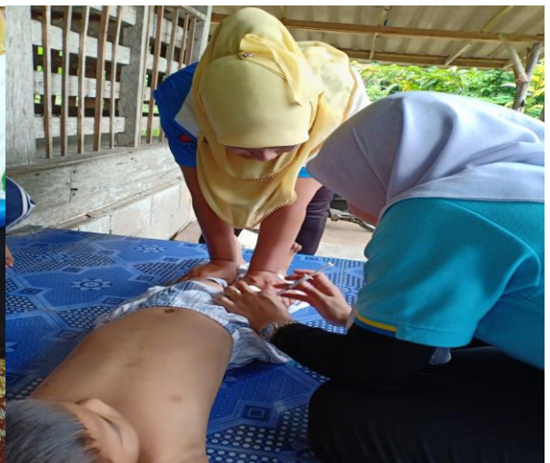
รณรงค์และติดตามเด็ก อายุ 0-5 ปี ที่ได้รับวัคซีนไม่ครบตามเกณฑ์