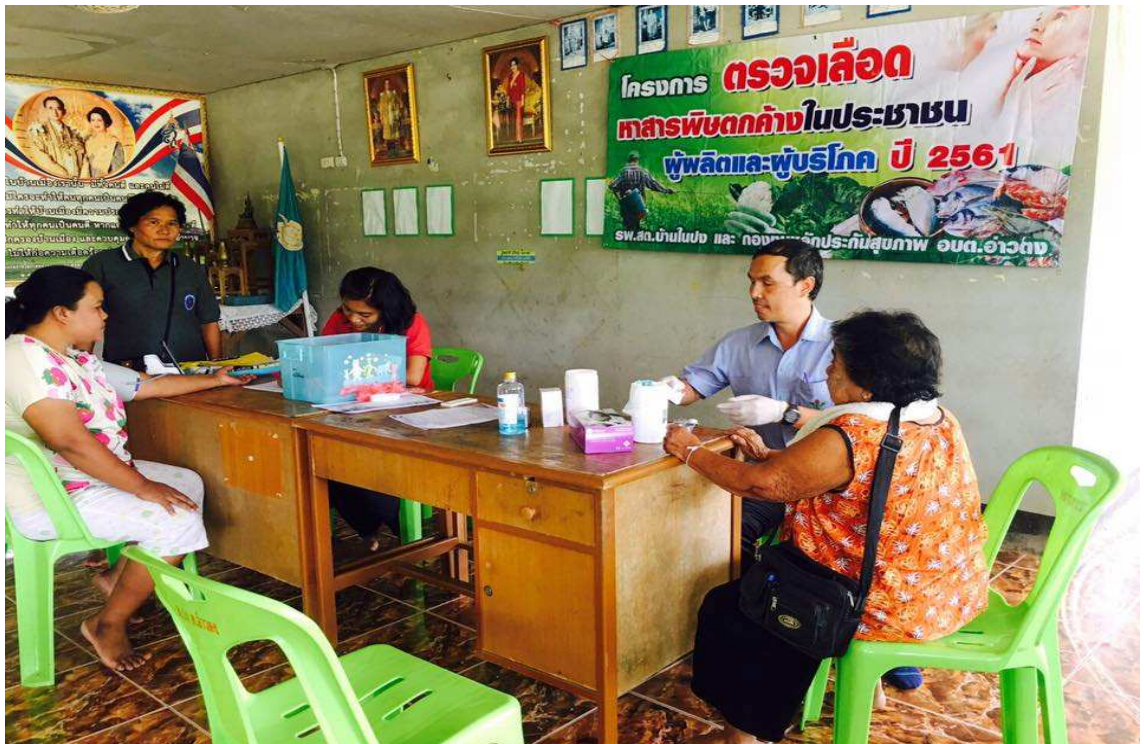
ภาพกิจกรรมโครงการอบรมเชิงปฏิบัติการตรวจเลือดหาสารพิษตกค้างในประชาชนผู้ผลิตและผู้บริโภค ปี ๒๕๖๑