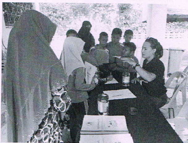
ภาพบรรยากาศการลงทะเบียนของ ผู้เข้าร่วมโครงการ

วันที่ ๒๔ เดือน กรกฎาคม พ.ศ. ๒๕๖๐ เริ่มรับลงทะเบียนตั้งแต่เวลา ๐๘.๓๐ น. โดยมีกลุ่มเป้าหมายเข้าร่วมทั้งสิ้นจำนวน ๗๐ คน ประกอบด้วย สภากีฬาเด็กและเยาวชนตำบลกาญจนาภิเษกและนักเรียนจากโรงเรียนในพื้นที่เข้าร่วมจำนวน ๒ โรงเรียน คือ โรงเรียนบ้านป้อมยอง และโรงเรียนบ้านพอแม็ง