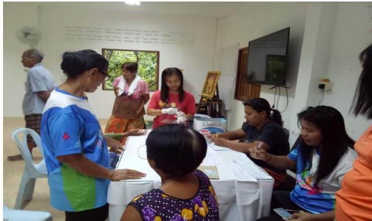
คัดกรองในชุมชนบ้านไถกาบ