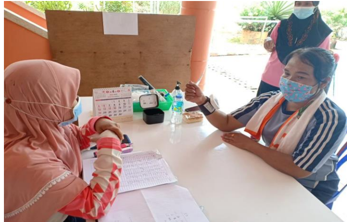
คัดกรองวัดความดันโลหิตสูง