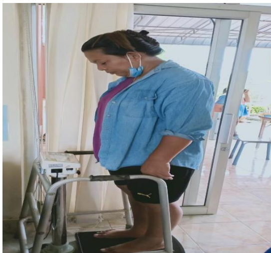
ชั่งน้ำหนัก