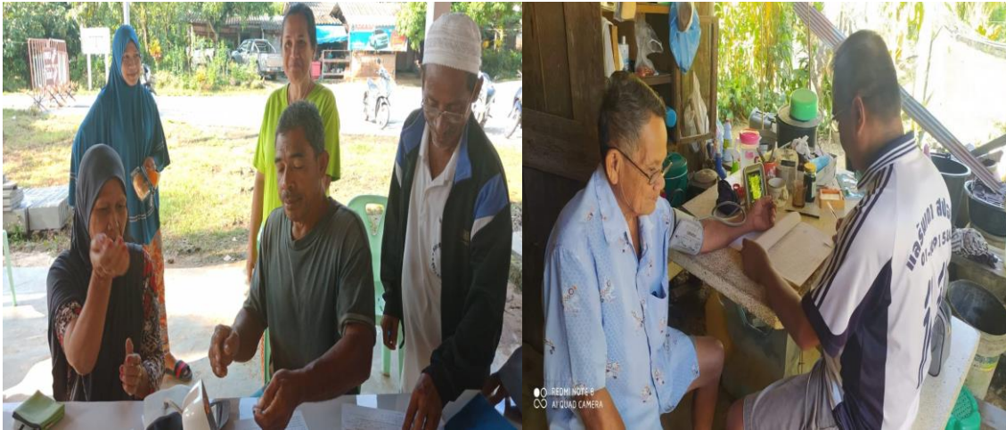
คัดกรองโรคความดันโลหิตสูง