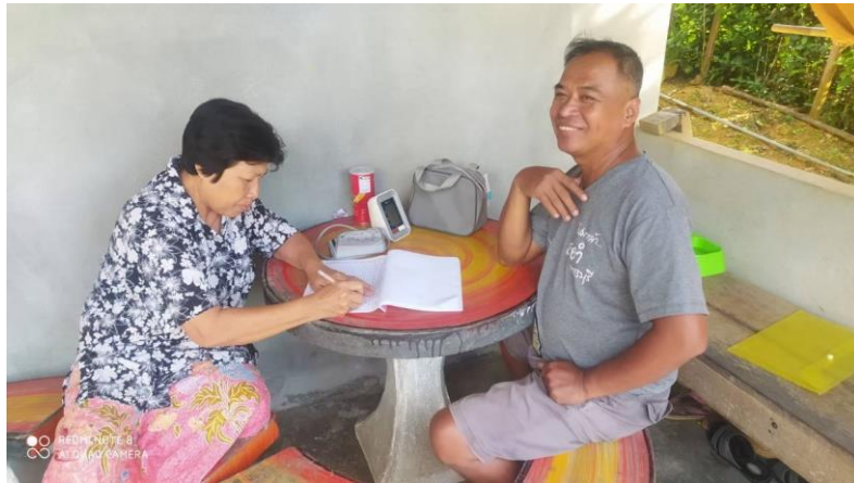
ลงทะเบียนคัดกรอง