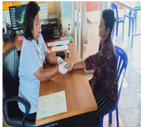
คัดกรองเบาหวาน