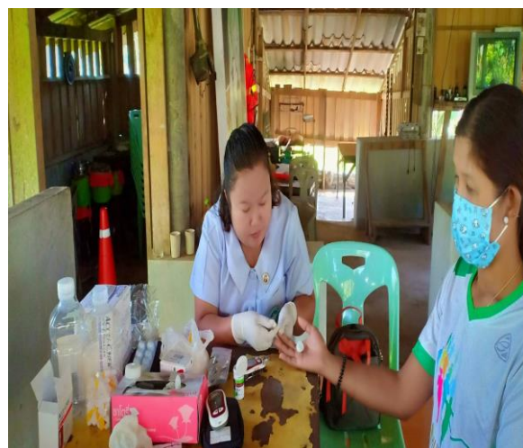
คัดกรองเบาหวาน