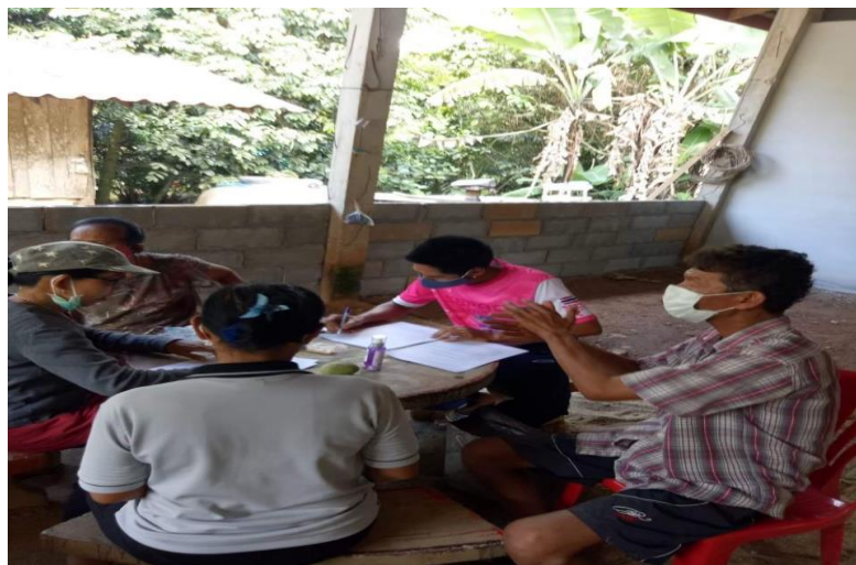
คัดกรองในชุมชนบ้านไถกาบ