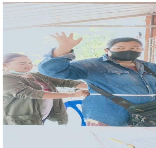
วัดรอบเอว