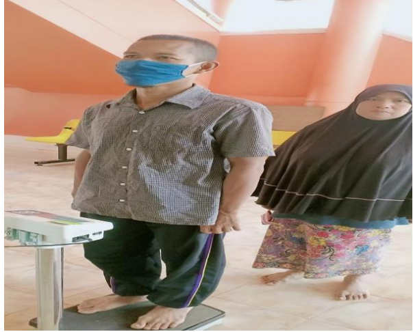
ชั่งน้ำหนัก