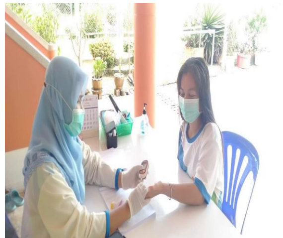
คัดกรองเบาหวาน