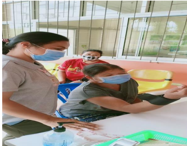
คัดกรองโรคความดันโลหิตสูง