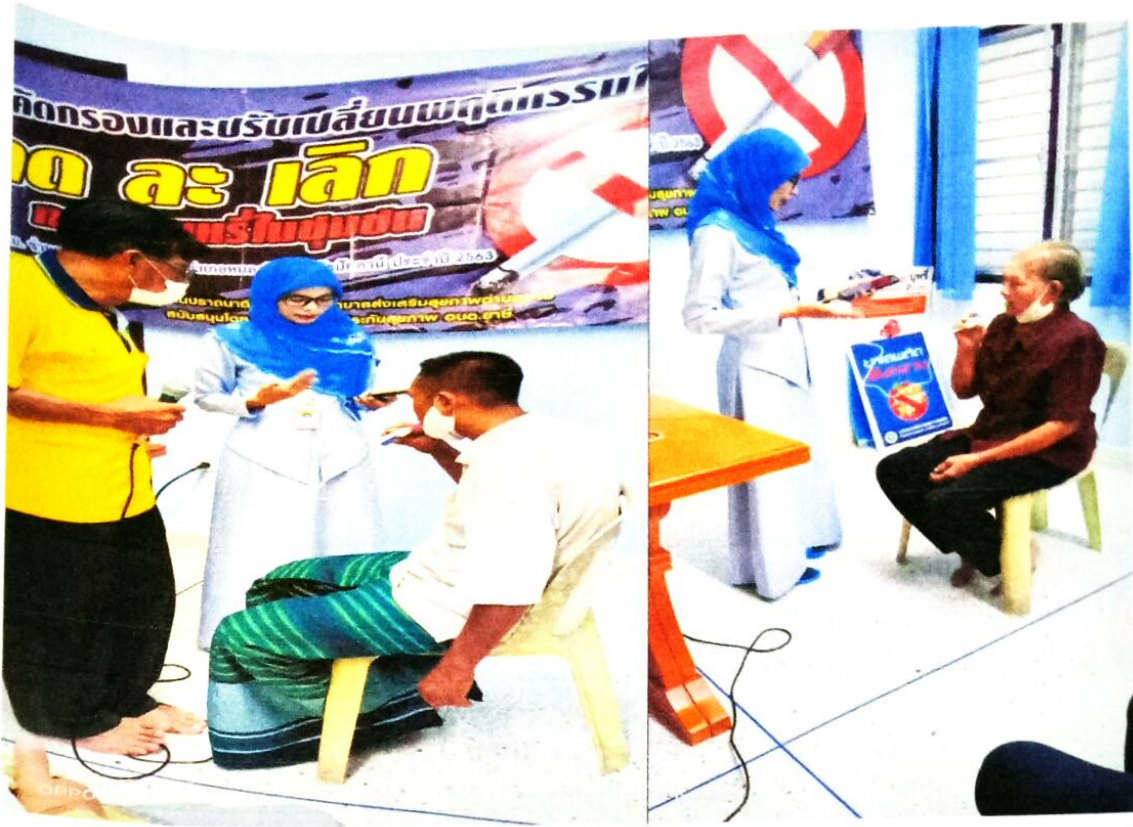
กิจกรรมตรวจสุขภาพและคัดกรองพฤติกรรมกาสูบบุหรี