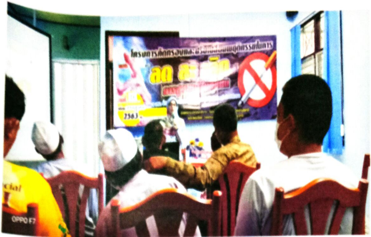
กิจกรรมให้ความรู้และปรับเปลี่ยนพฤติกรรมในการลด ละ เลิกบุหรี่