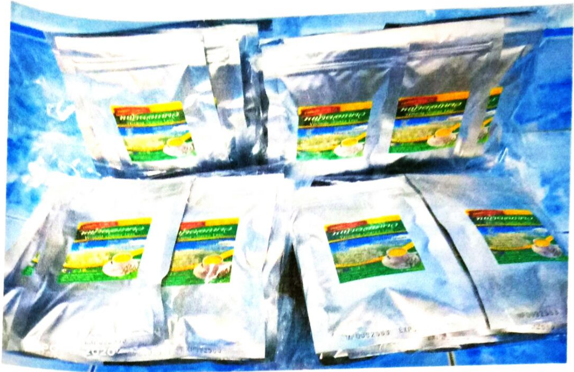
สมุนไพรหญ้าดอกขาว (ชาชง)