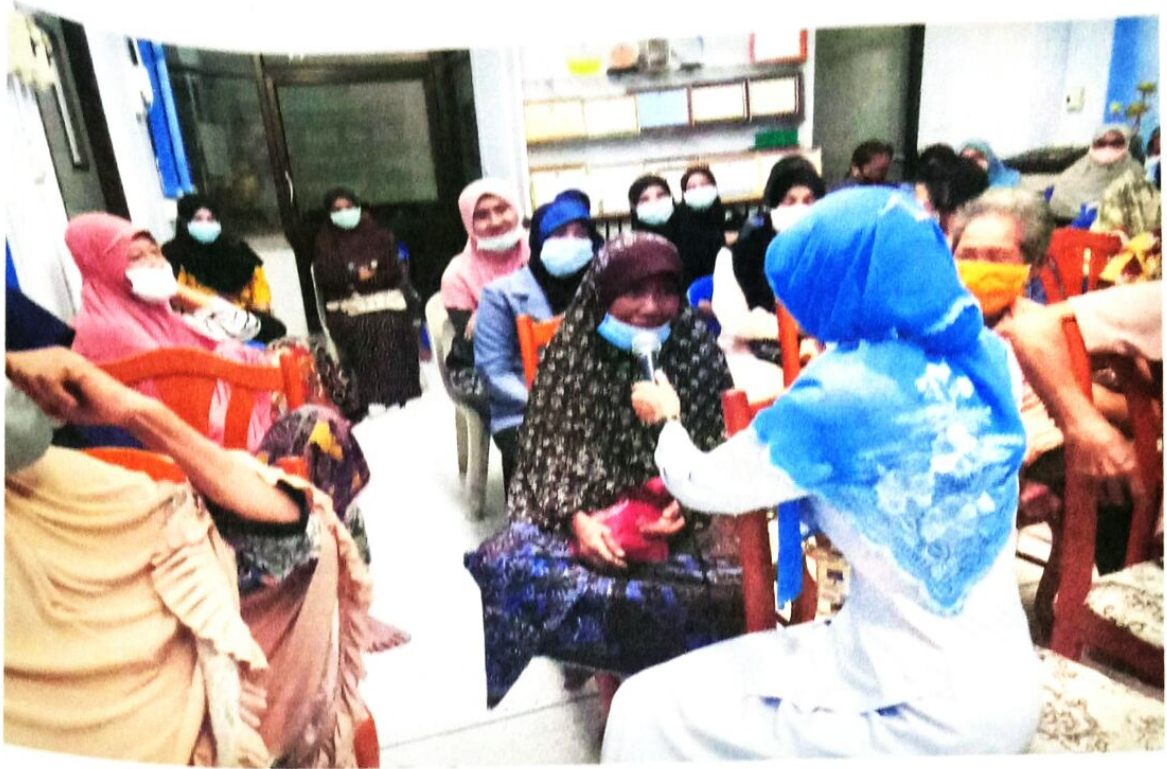
กิจกรรมแลกเปลี่ยนเรียนรู้