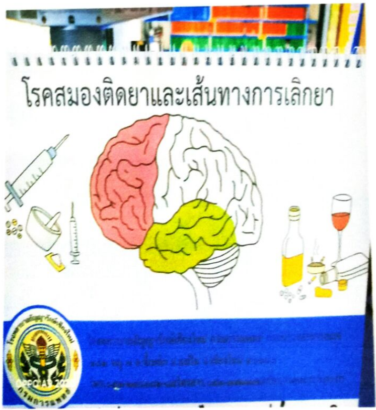
คู้มมือสื่อบุหรี และภาพพลึกสื่อเรื่องบุหรีและยาเสฟตึด