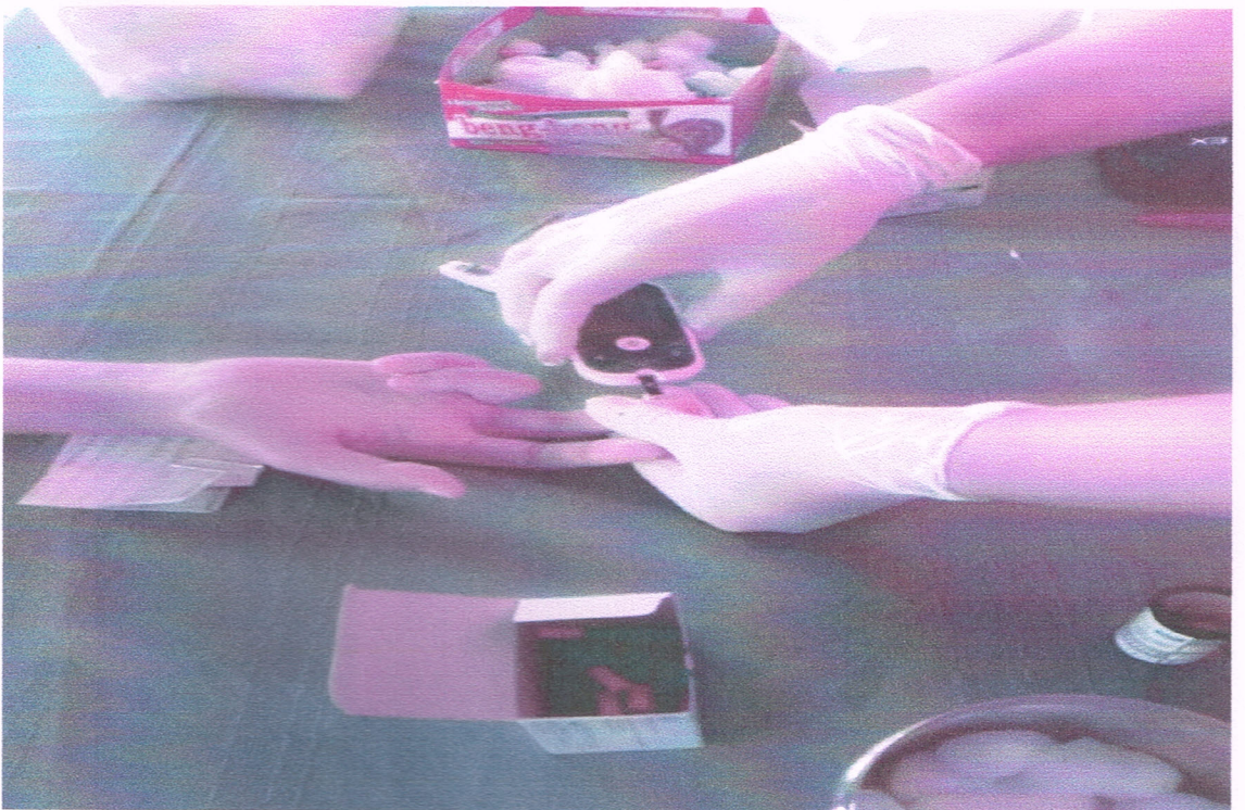
กิจกรรมอบรม อสม.และฝึกปฏิบัติการเจาะเลือดที่ปลายนิ้ว