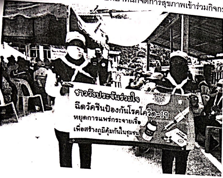
บทบาทนักจัดการสุขภาพเข้าร่วมกิจกรรมจิตอาสา