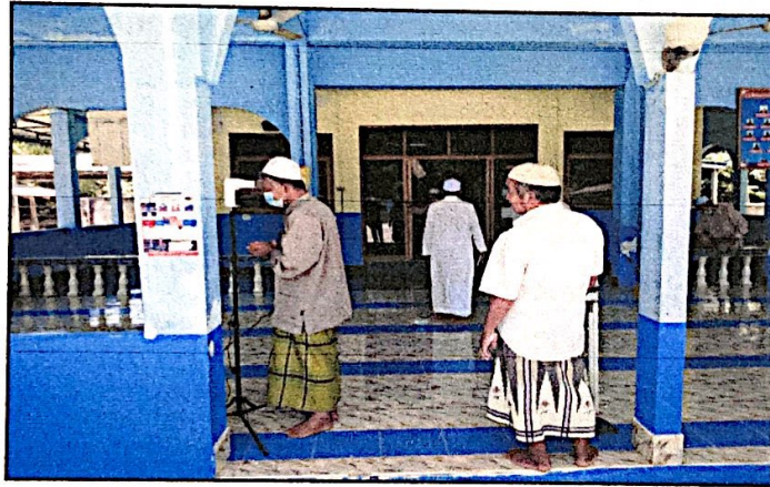
ตรวจวัดอุณหภูมิร่างกาย