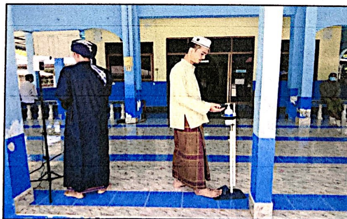
ล้างมือด้วยแอลกอฮอล์