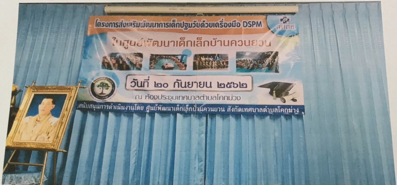
นายวิศิษฐ์ ชูสง นายกเทศมนตรีประธานเปิดโครงการ

โครงการส่งเสริมพัฒนาการด้วยเครื่องมือ DSPM ในศูนย์พัฒนาเด็กเล็กบ้านควนยวน วันที่ ๒๐ กันยายน ๒๕๖๒ ณ ห้องประชุมเทศบาลตำบลโคกม่วง อ.เขาชัยสน จ.พัทลุง