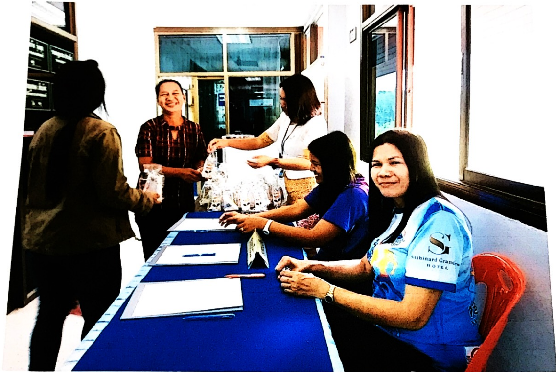
ผู้ปกครองลงทะเบียน และรับประทานอาหารว่าง