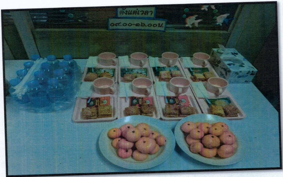
ภาพอาหารว่างพร้อมเครื่องดื่ม การประชุมคณะกรรมการด้านนิจรรณการกลับกรองโครงการ ครั้งที่ ๒/๒๕๖๐ วันที่ ๕ มกราคม ๒๕๖๐