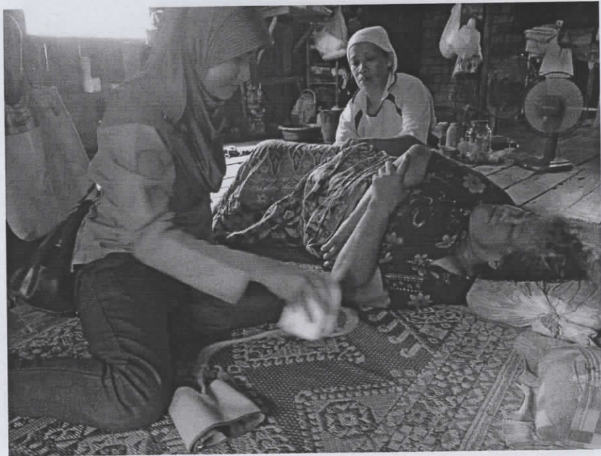
เยี่ยมบ้านโดยทีมหมอครอบครัว