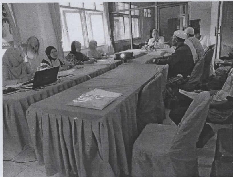
อบรมทีมหมอครอบครัว