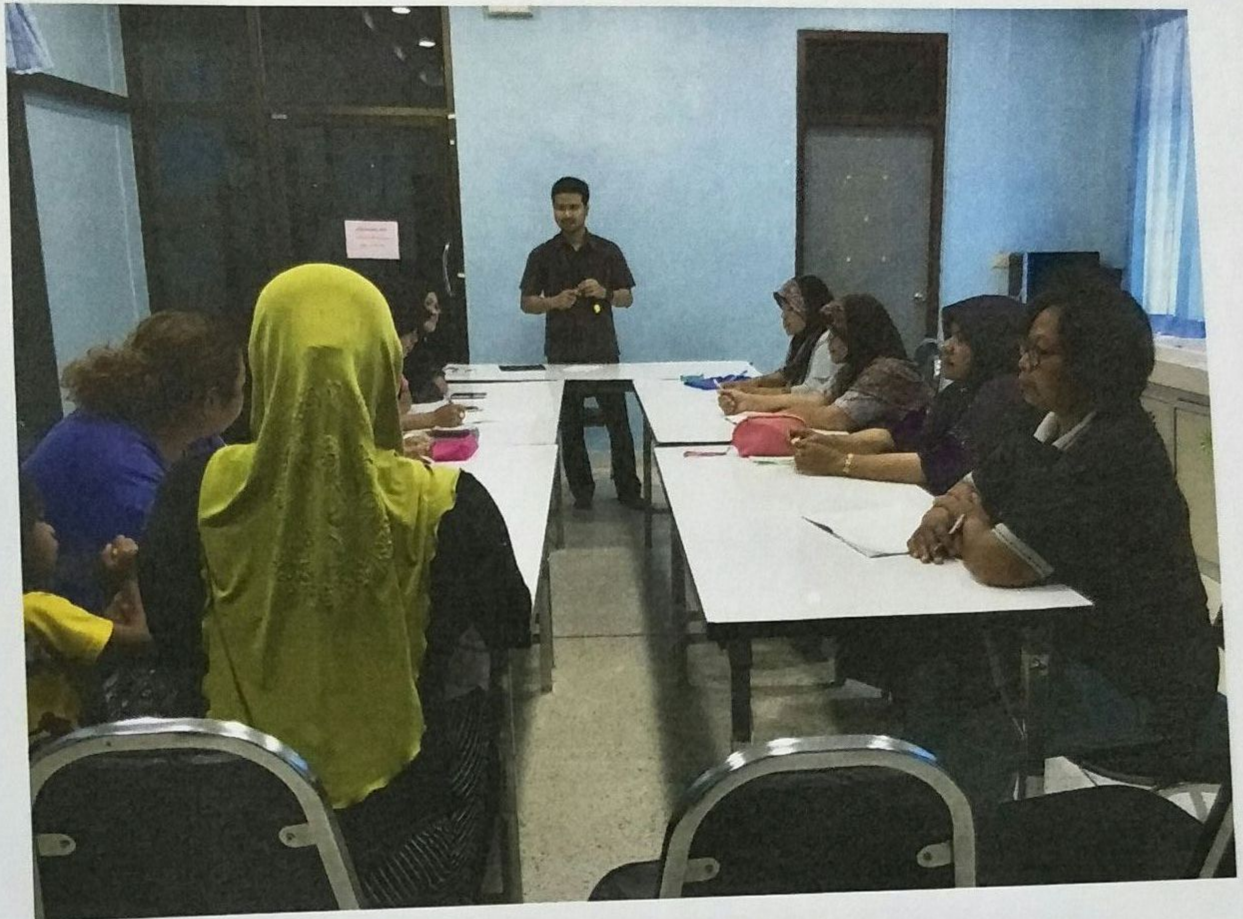
ภาพกิจกรรม จัดประชุมชี้แจงโครงการป้องกันและควบคุมโรคไข้เลือดออก ตำบลทรายขาว ปี ๒๕๖๐ แก่ จนท. และ ตัวแทน อสม.