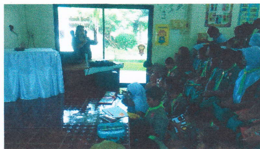
ช่วงเข้าให้ความรู้เรื่องการคัดแยกขยะ