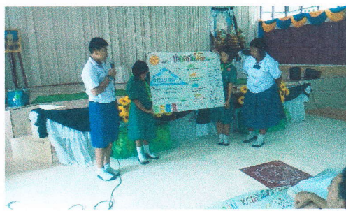
ช่วงป้าย น.ร. ประมวลผลการเรียนรู้แล้วนำเสนอผลงานเป็นรายกลุ่ม