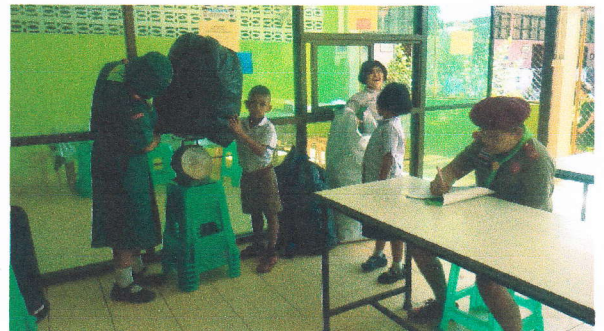
นักเรียนนำขยะมาซึ่งนำหนักเพื่อฝากธนาคาร