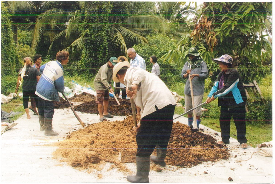
สมาชิกผู้สูงอายุ ร่วมมือโครงการผสมวัสดุทำปุ๋ยหมัก ๙ ๙ ๙ ๙ ๙ ๙