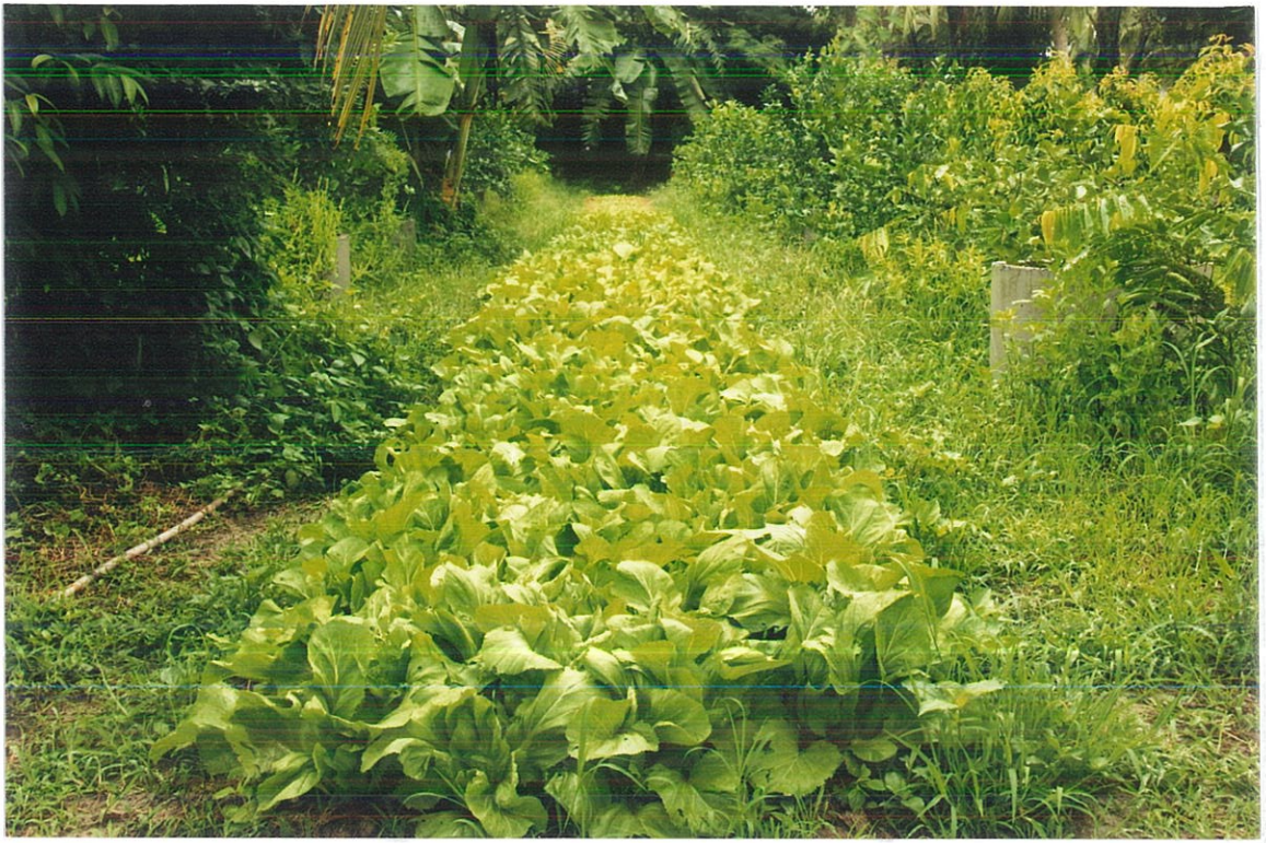
แปลงสาธิตการปลูกผักปลอดสารพิษในโครงการฯ