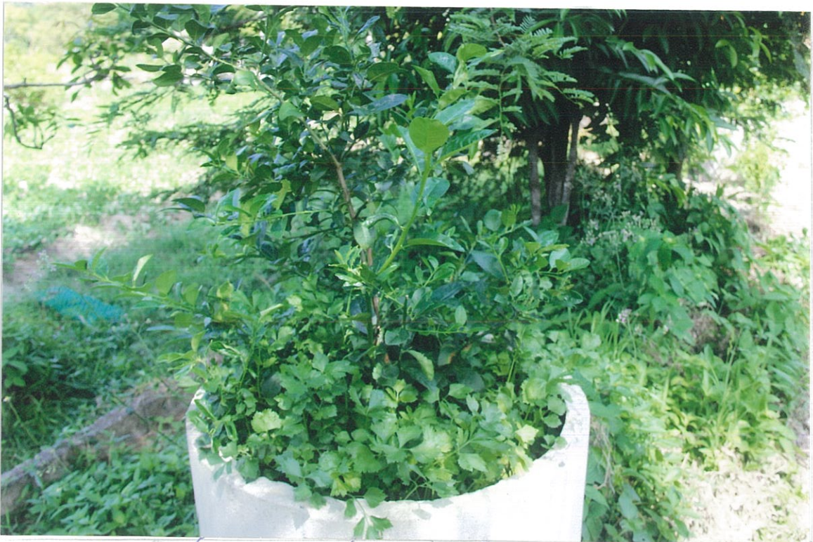
การปลูกผักสวนครัวร่มก้ามมะนาวในท่อน้ำฝน