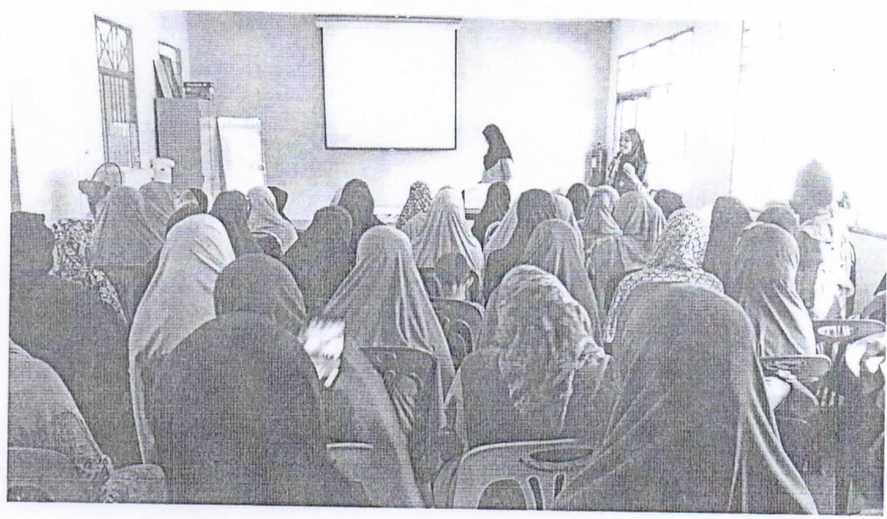
ภาพกิจกรรมการดำเนินโครงการพัฒนารูปแบบการบริการวิชาการด้านภูมิปัญญาสมุนไพรเพื่อสุขภาพและการพึ่งพาตนเอง