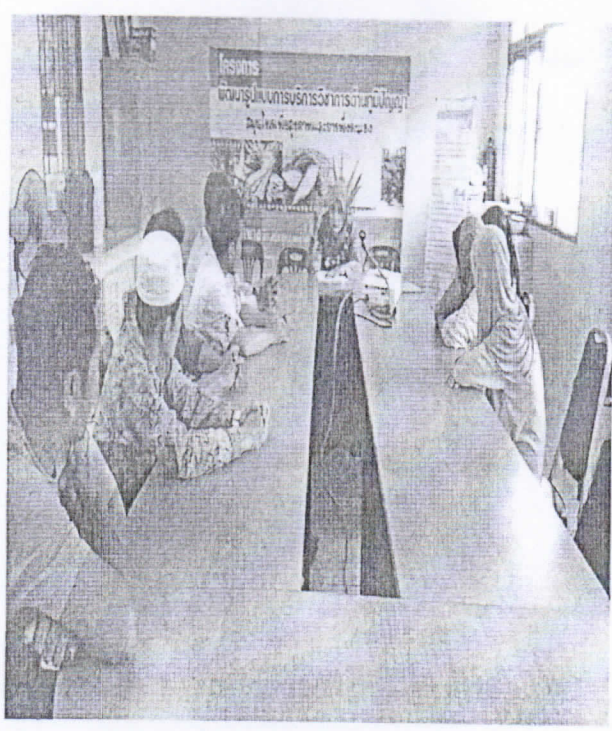
ภาพกิจกรรมการดำเนินโครงการพัฒนารูปแบบการบริการวิชาการด้านภูมิปัญญาสมุนไพรเพื่อสุขภาพและการพึ่งพาตนเอง