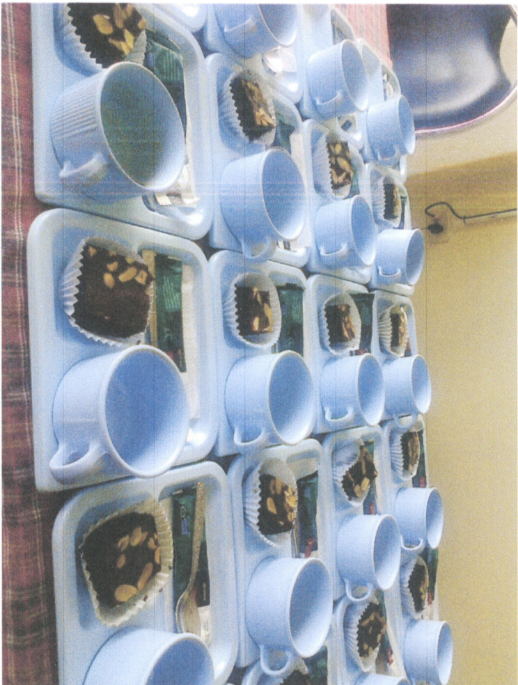
ภาพกิจกรรม