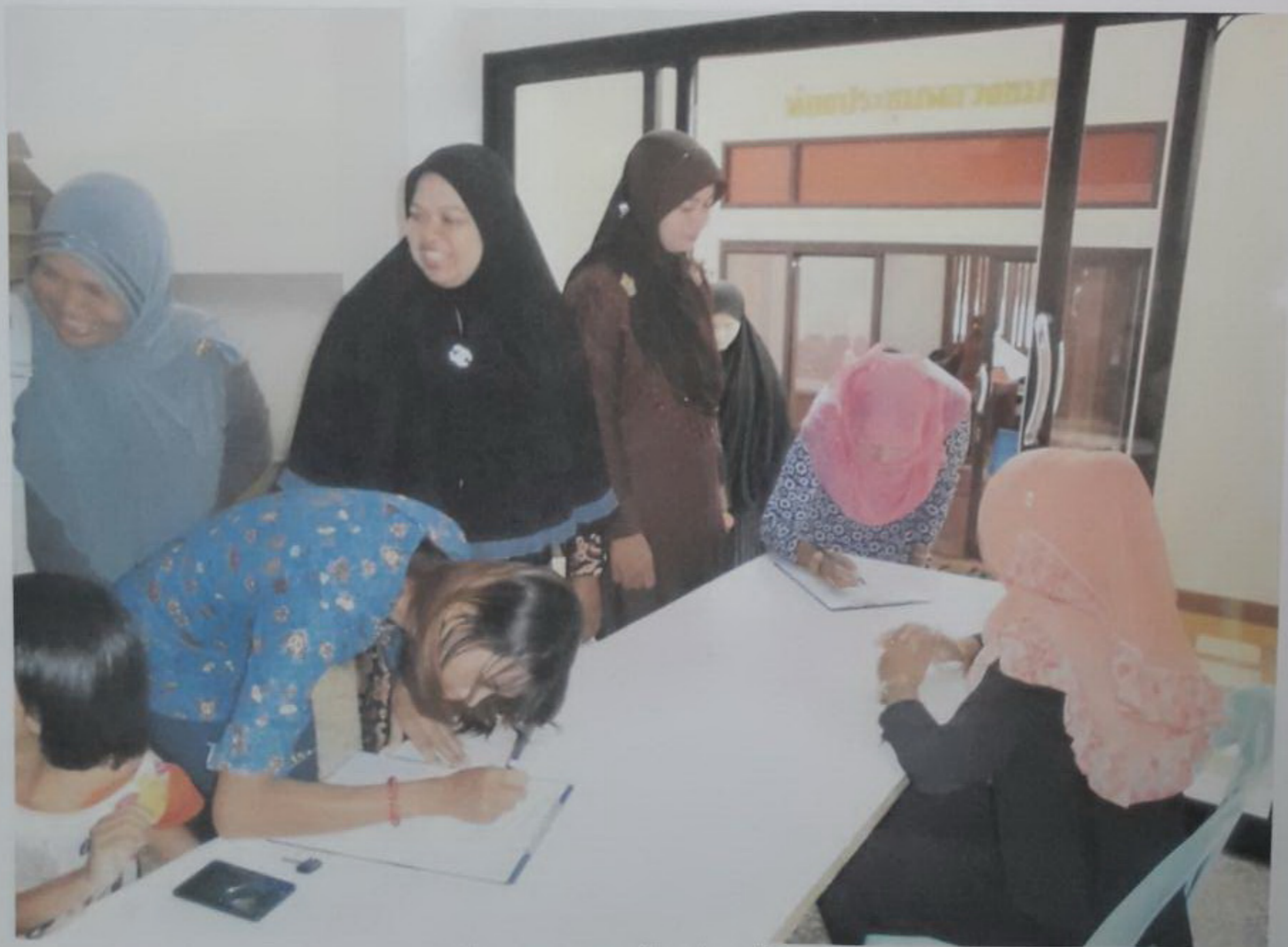
ประชาชนลงทะเบียนก่อนเข้างาน