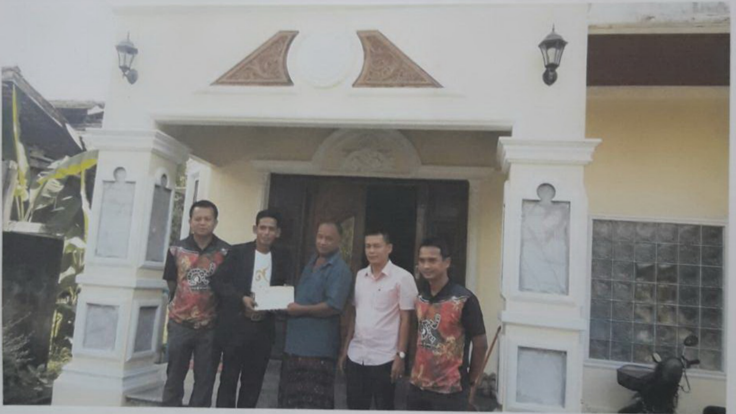
มอบเงินรางวัลพร้อมประกาศนียบัตรแก่บ้านที่ได้รับการประเมินที่ชนะเลิศ