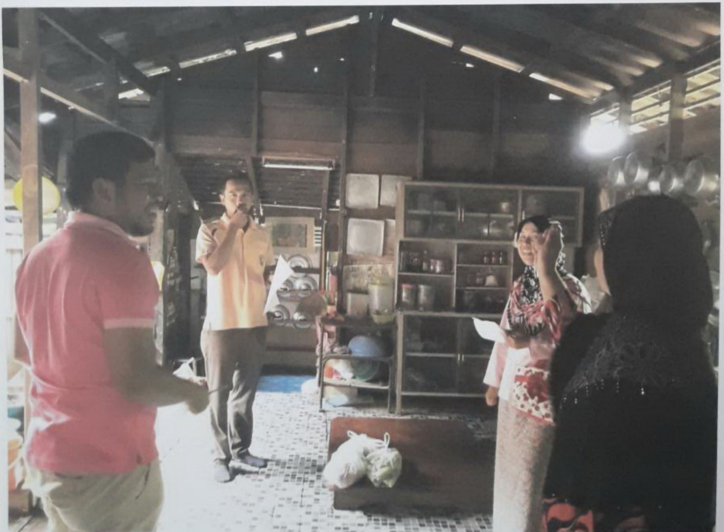
ออกประเมินบ้านพร้อมเจ้าหน้าที่