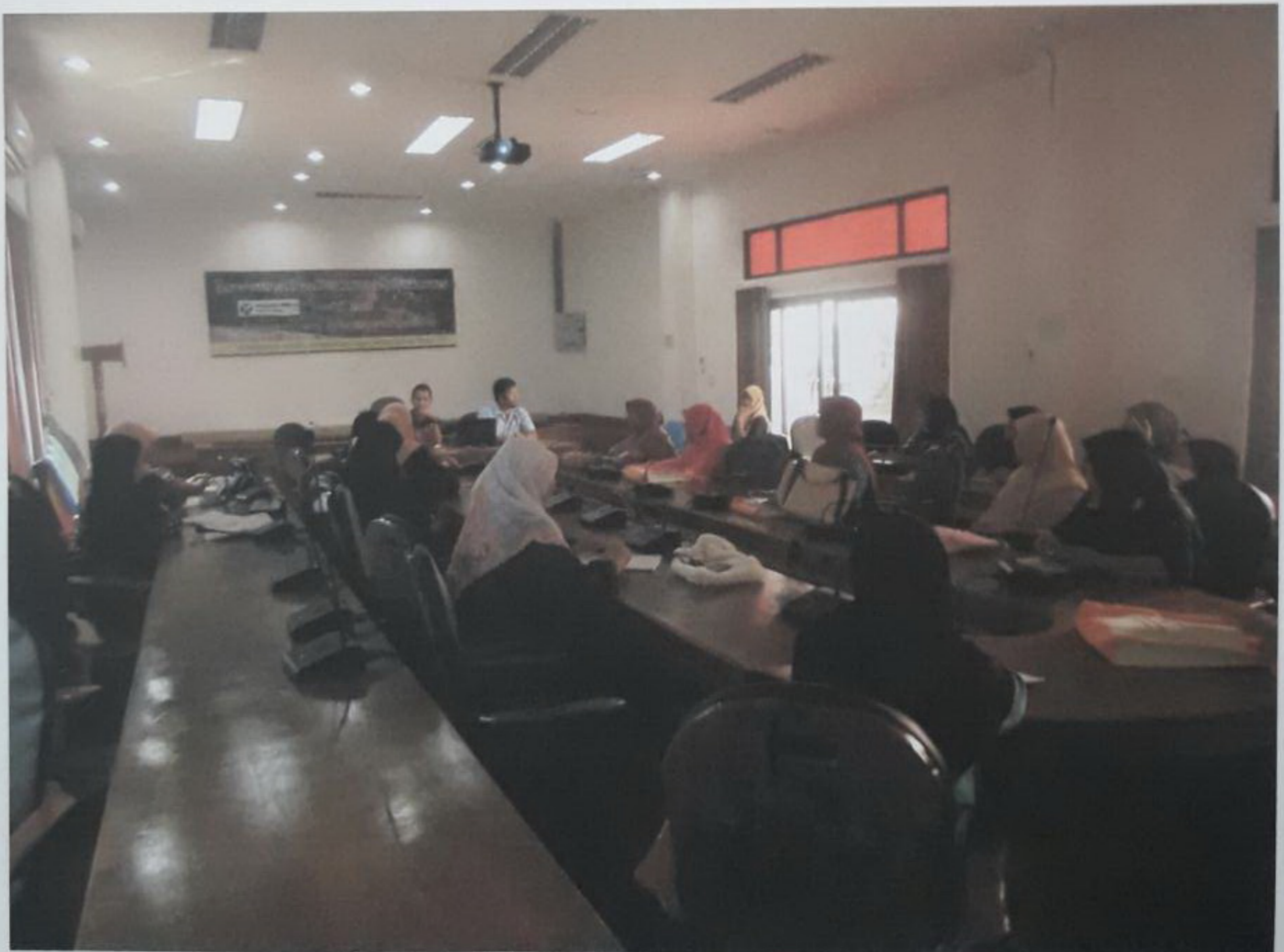
วิทยากรให้ความรู้เรื่องการป้องกันและควบคุมโรคไข้เลือดออก