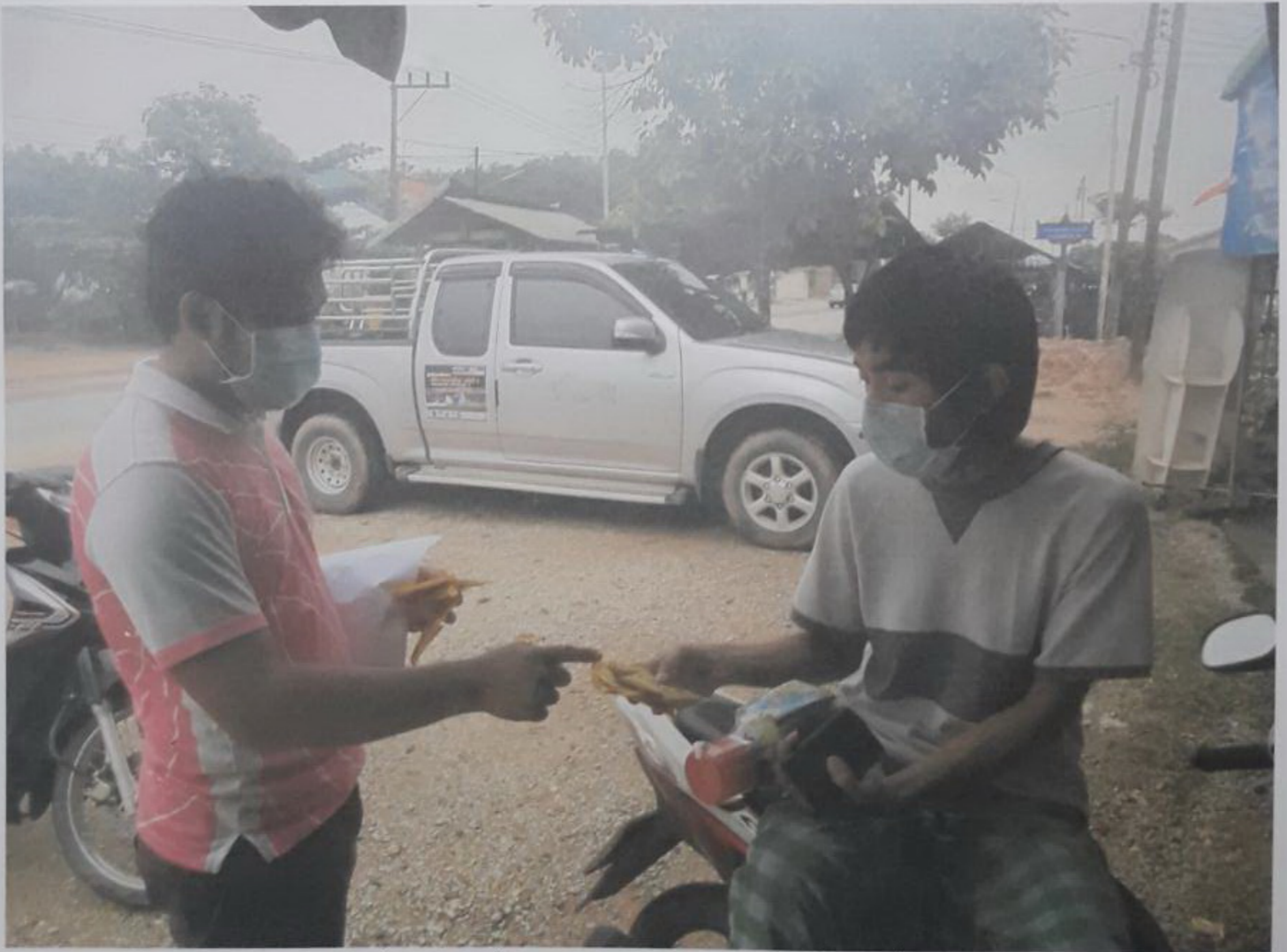
พ่นหมอกควันและแจกทรายอะเบทกับเจ้าหน้าที่