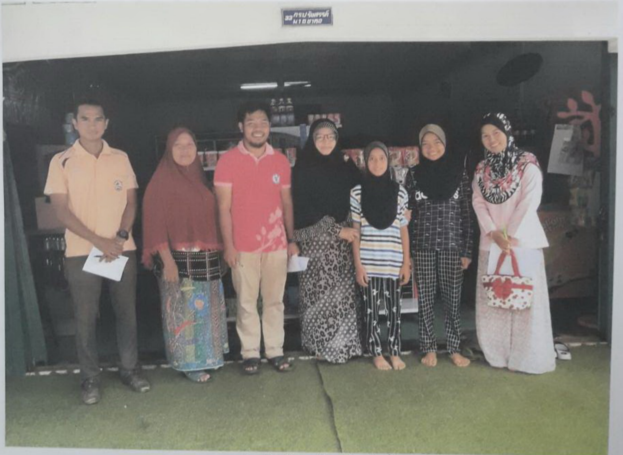
ออกประเมินบ้านพร้อมเจ้าหน้าที่