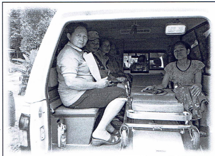
รับกลุ่มเป้าหมายตามหมู่บ้านมาตรวจพร้อมให้ความรู้ ณ รพ.สต.ลำใหม่