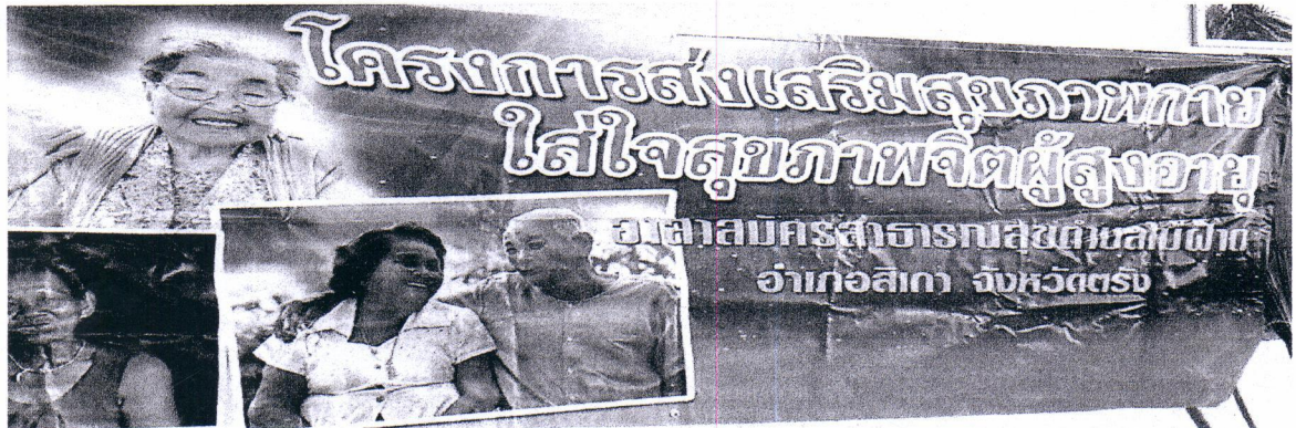
กิจกรรม (การรับลงทะเบียน)