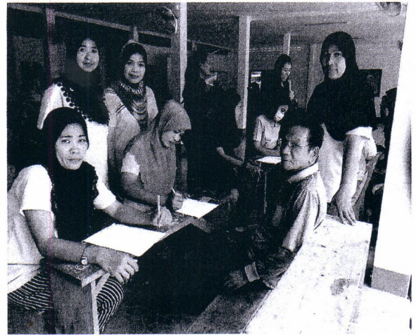
กิจกรรม (การตรวจสุขภาพเบื้องต้น)