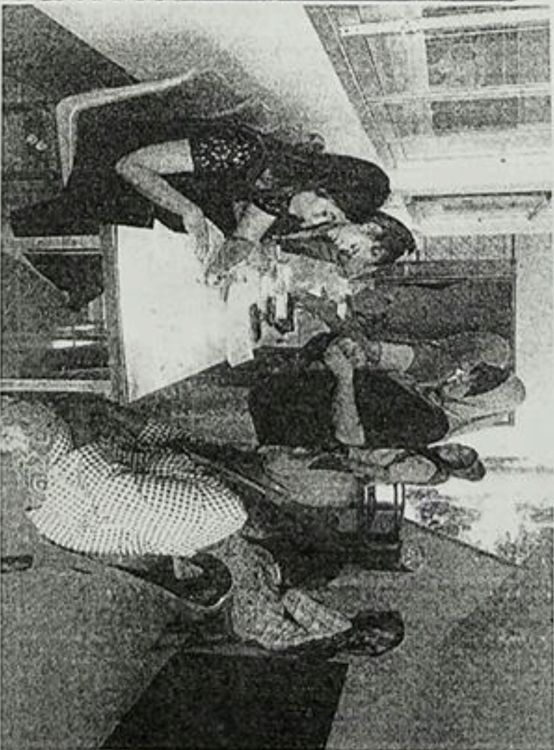
การตรวจสอบตัดกรงมะพร้าวปากมดลูก