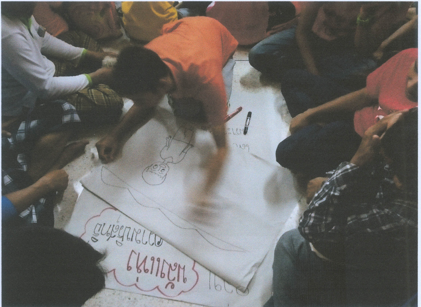
๓. จัดกิจกรรมเสริมทักษะในการจัดการกับสถานการณ์ที่เกี่ยวข้องกับเรื่องเพศ(ต่อ)