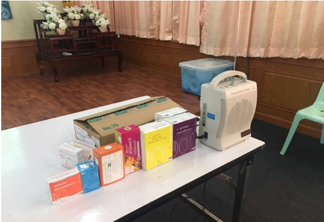
ภาพกิจกรรมโครงการอบรมเชิงปฏิบัติการผู้ประกอบการอาหาร ร้านอาหารแฝงลอยในชุมชน ปี ๒๕๖๑