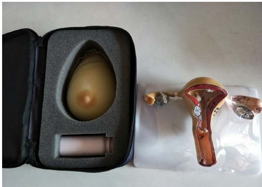
โมเดลมะเร็งปากมดลูก และโมเดลมะเร็งเต้านม