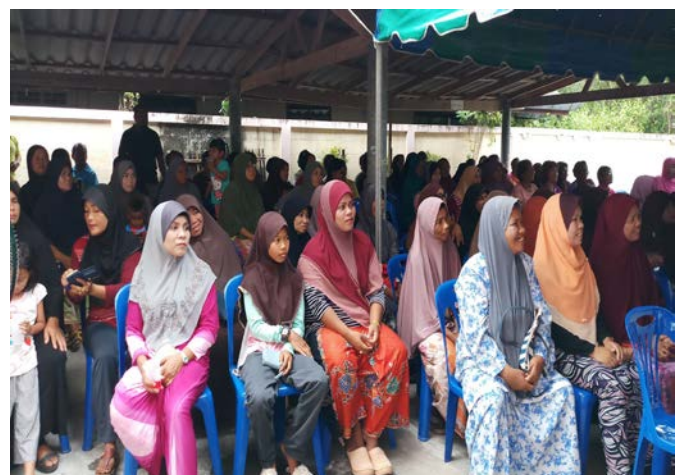
กิจกรรมให้ความรู้