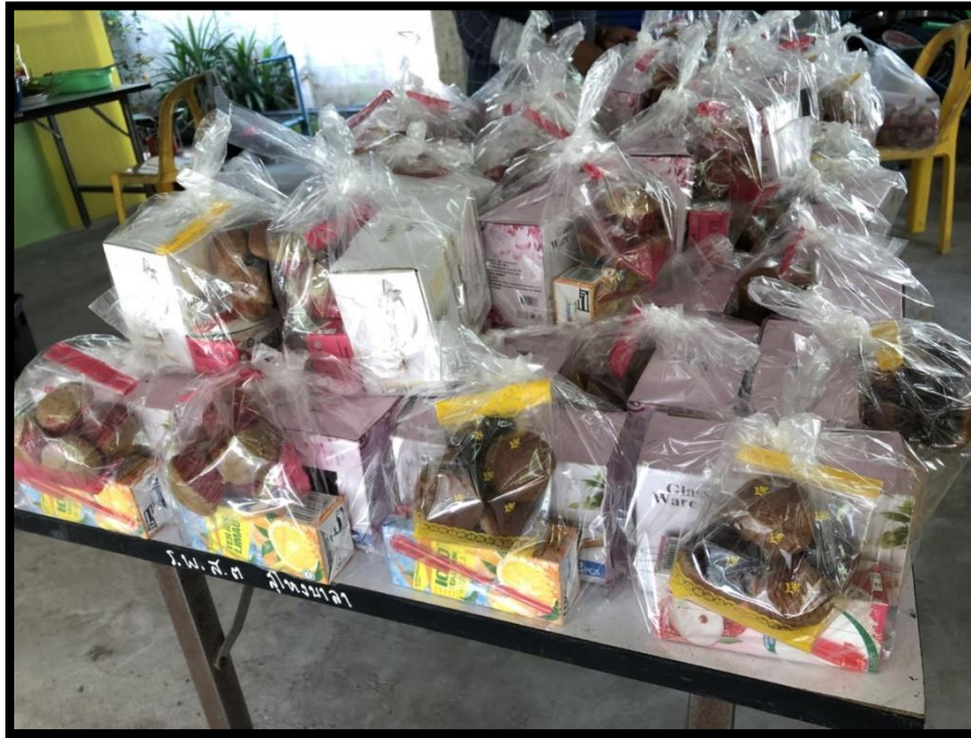
อาหารกลางวัน