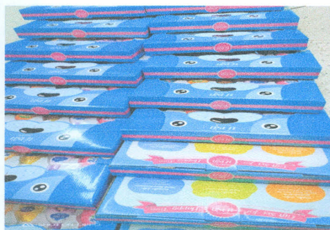
- ภาพกิจกรรม เยี่ยมหลังคลอด