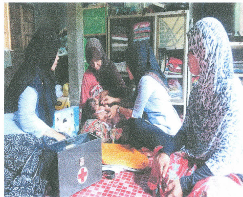
๑.๒ กิจกรรมอบรมหลักสูตรโรงเรียนพ่อแม่ “พ่อแม่ คุณภาพชีวิตตามวิถีชุมชนะฮ์” และรู้ชีวิตก่อนและหลังแต่งงานตามวิถีชุมชนะฮ์