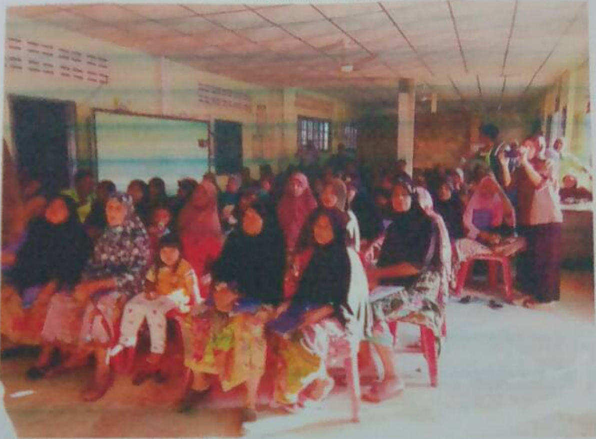
ประมวลภาพกิจกรรม