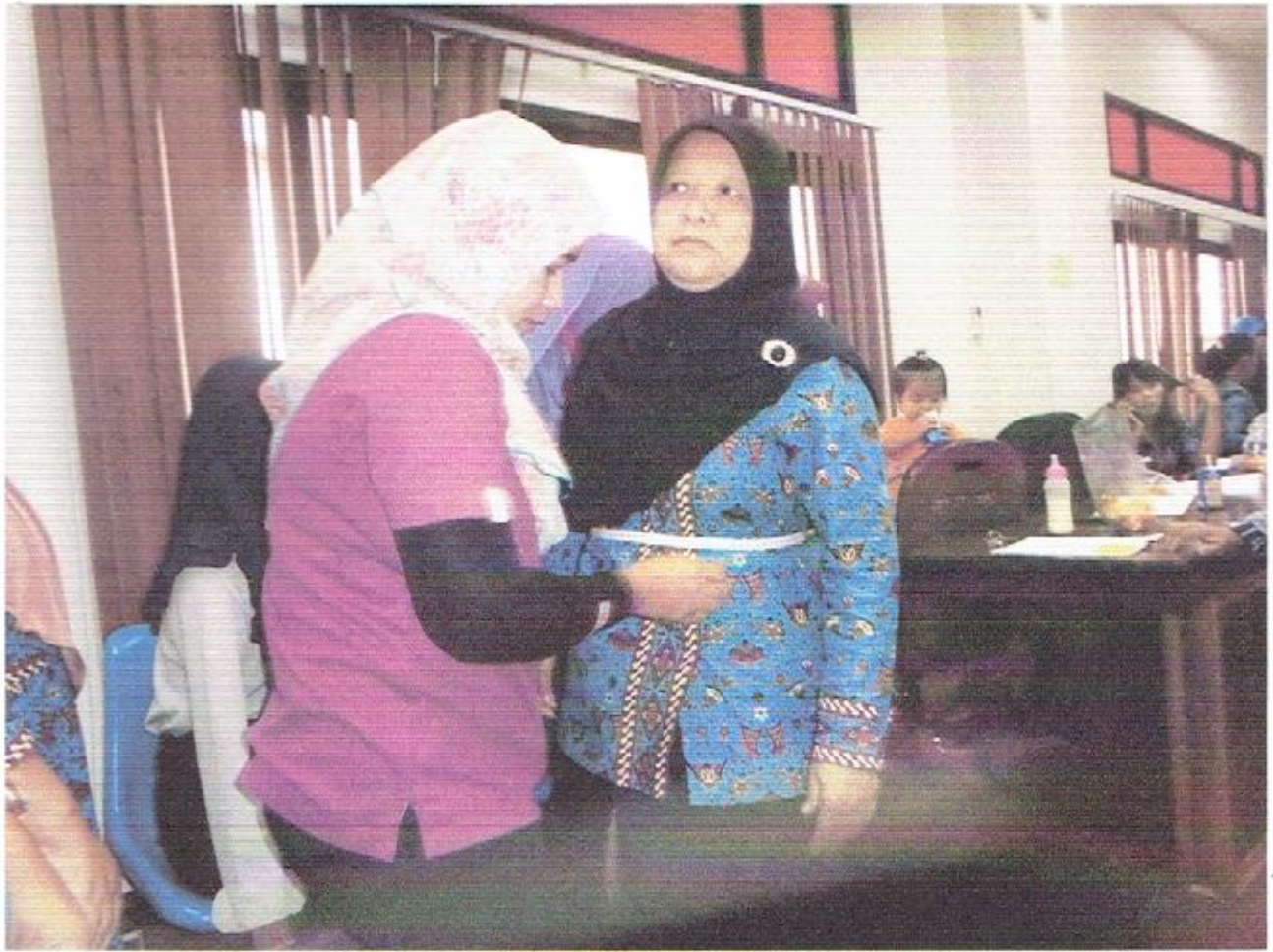
วัดรอบเอวเพื่อประเมินสุขภาพผู้เข้าร่วมโครงการ