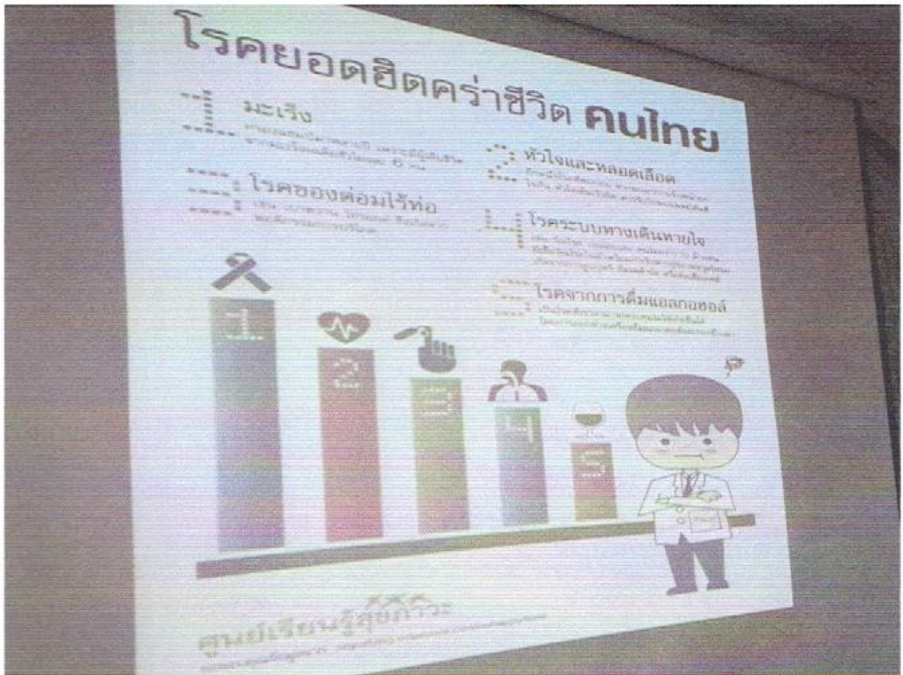
วิทยากรกำลังบรรยายเรื่องโทษภัย ตลอดจนวิธีการดูแลตนเองให้ห่างไกลจากโรคอ้วน