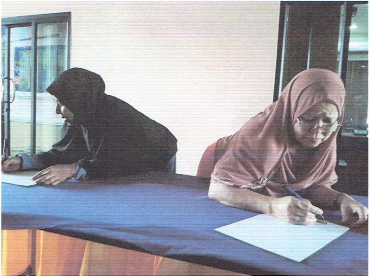
ลงทะเบียนเข้าร่วมโครงการ