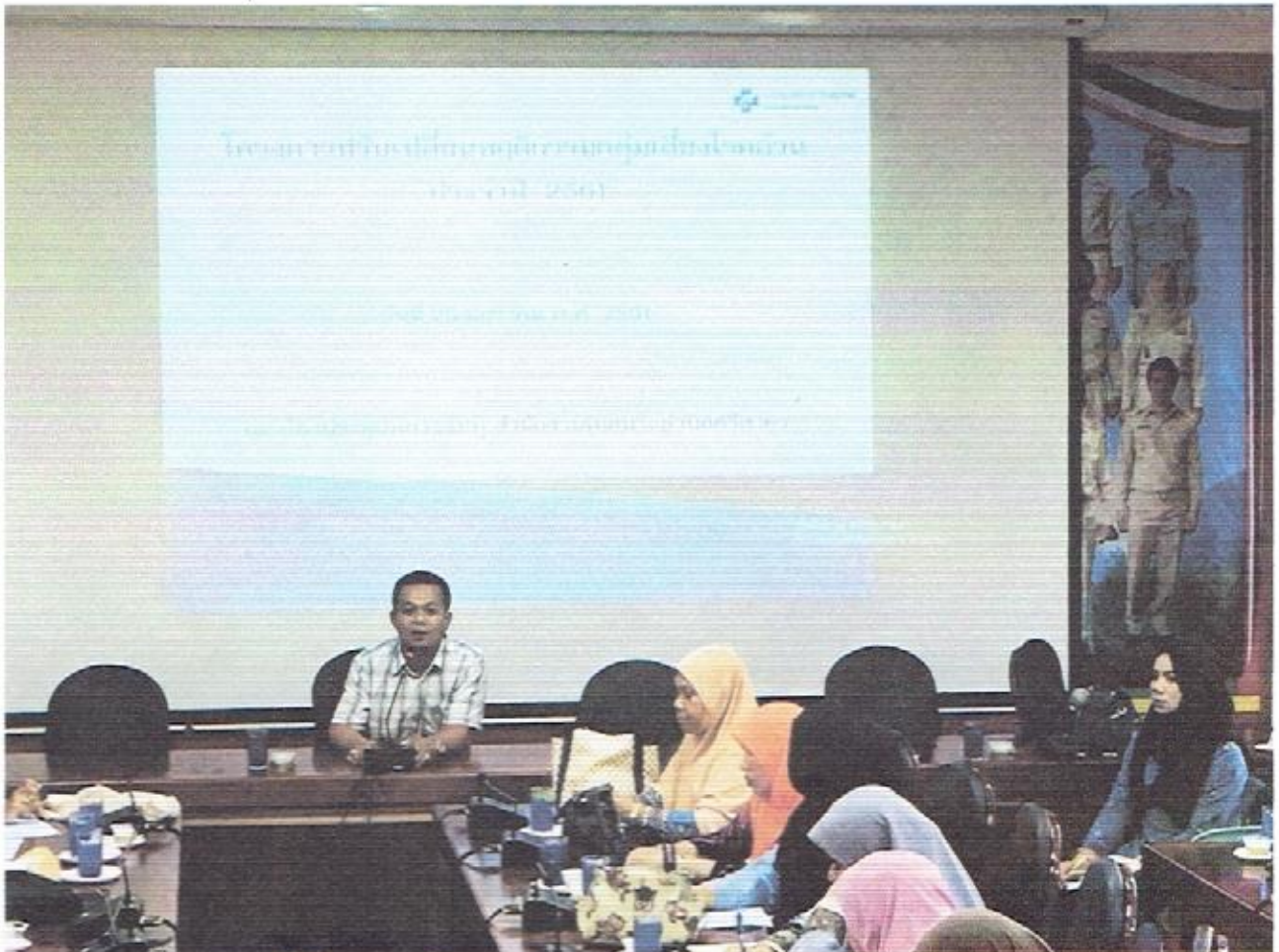
วิทยากรกำลังบรรยายเรื่องโทษภัย ตลอดจนวิธีการดูแลตนเองให้ห่างไกลจากโรคฮัน