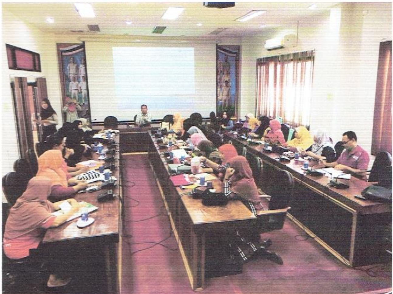
วิทยากรกำลังบรรยายเรื่องโทษภัย ตลอดจนวิธีการดูแลตนเองให้ห่างไกลจากโรคอ้วน