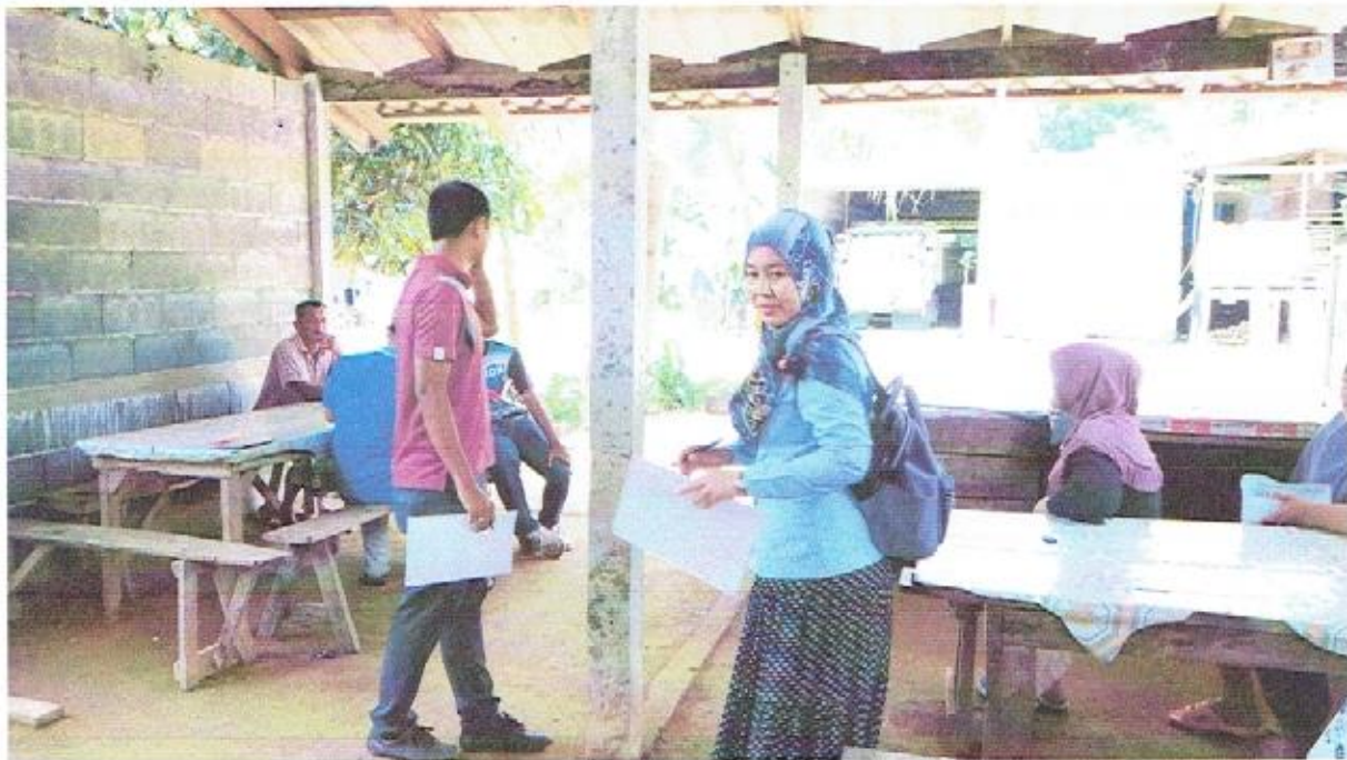
ออกประเมินบ้านพร้อมเจ้าหน้าที่