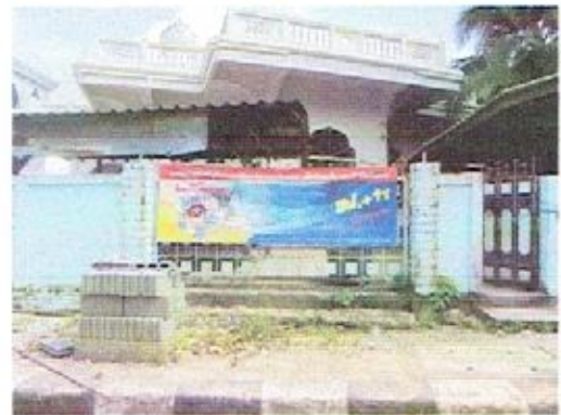
ประชาสัมพันธ์รณรงค์การป้องกันควบคุมโรคไข้เลือดออกในชุมชน