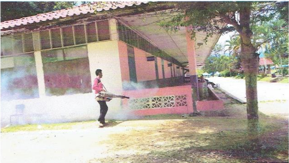
พ่นหมอกควันในชุมชนและสถานศึกษา