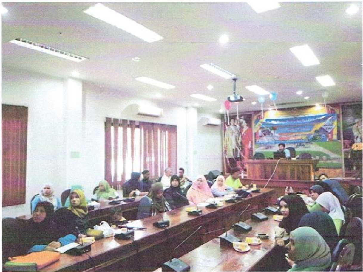
วิทยากรให้ความรู้เรื่องการป้องกันและควบคุมโรคไข้เลือดออก