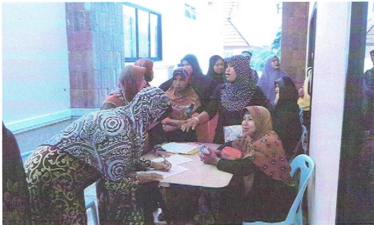
ประชาชนลงทะเบียนก่อนเข้างาน