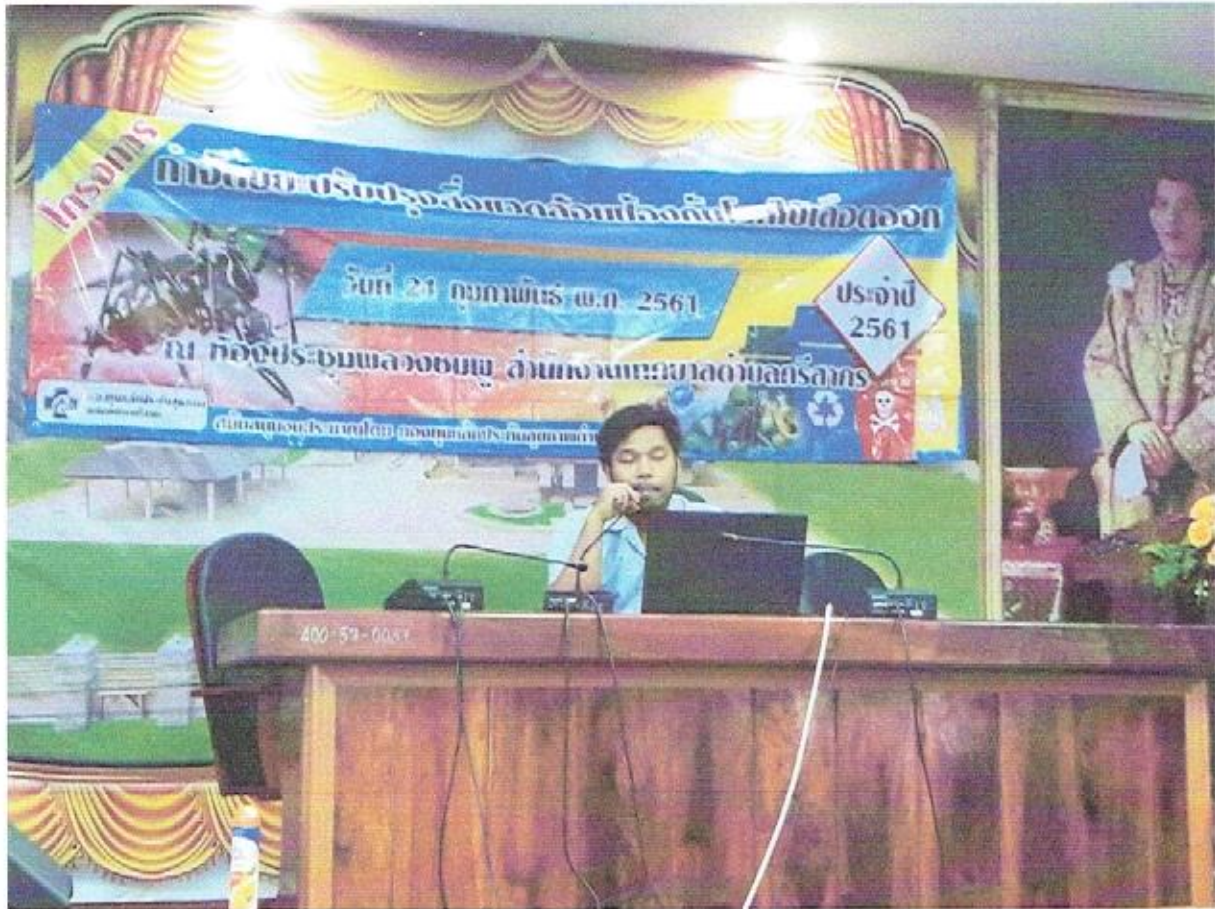
วิทยากรให้ความรู้เรื่องการป้องกันและควบคุมโรคไข้เลือดออก