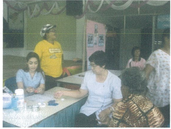
หมู่ที่ 10 ต.เขาชัยสน