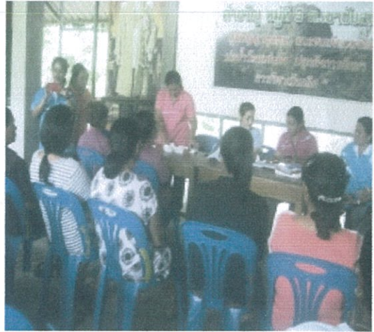
หมู่ที่ 3 ต.เขาชัยสน