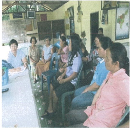
หมู่ที่ 5 ต.เขาชัยสน