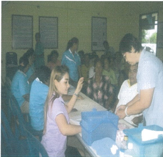
หมู่ที่ 4 ต.เขาชัยสน