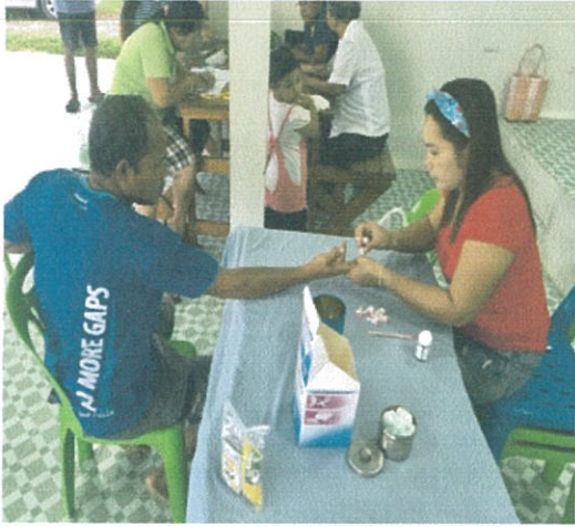
หมู่ที่ 2 ต.เขาชัยสน