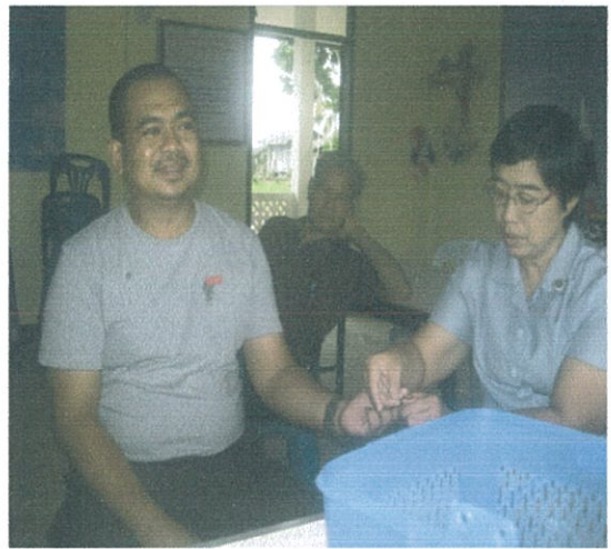
หมู่ที่ 13 ต.เขาชัยสน