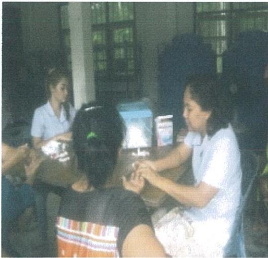
หมู่ที่ 11 ต.เขาชัยสน