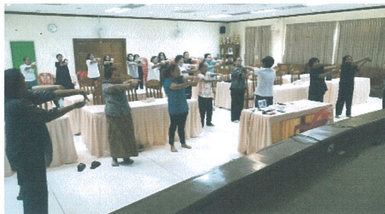
ฝึกยืดเหยียดกล้ามเนื้อ