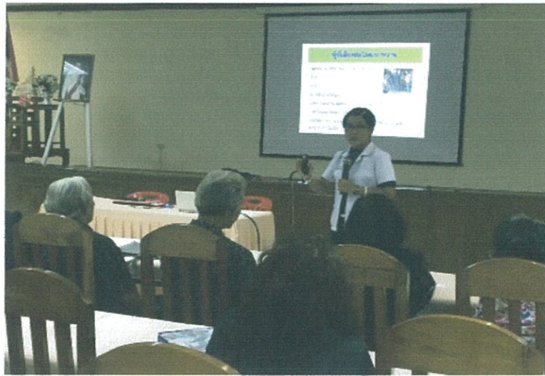
ให้ความรู้เรื่องโรคและ 3 อ 2 ส