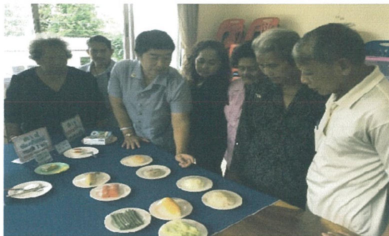
ความรู้เรื่องโภชนาการ