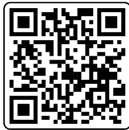
QR Code เอกสารตอบรับการเข้าร่วมประชุม