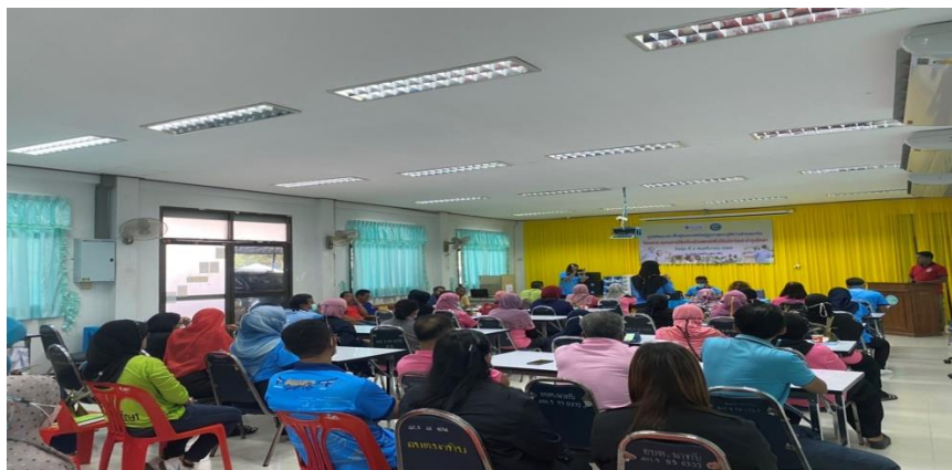
ภาพเปิดพิธี โดยนายกเทศมนตรีเทศบาลนาทับ