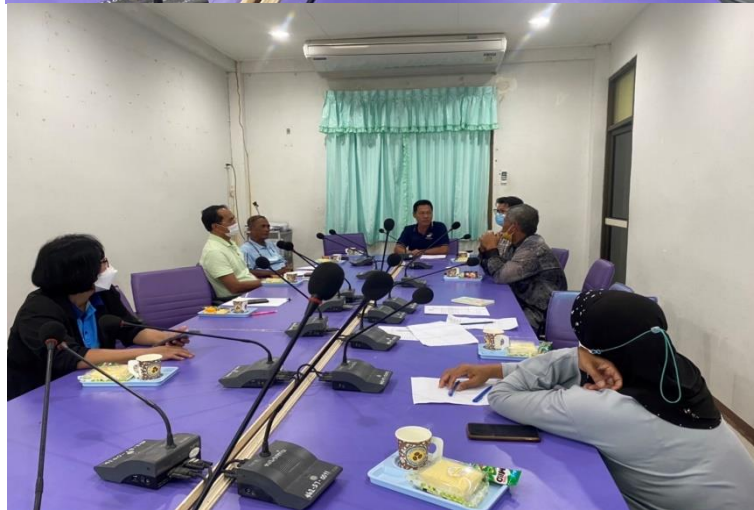
ภาพจัดประชุมวางแผนการดำเนินงาน วันที่ ๕/๑๐/๒๕๖๕