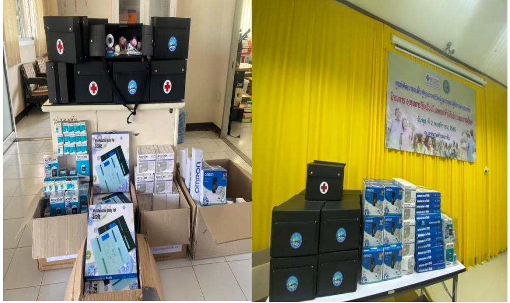
ภาพเครื่องมือแพทย์ รับของวันที่ ๑๗/๑๐/๒๕๖๕