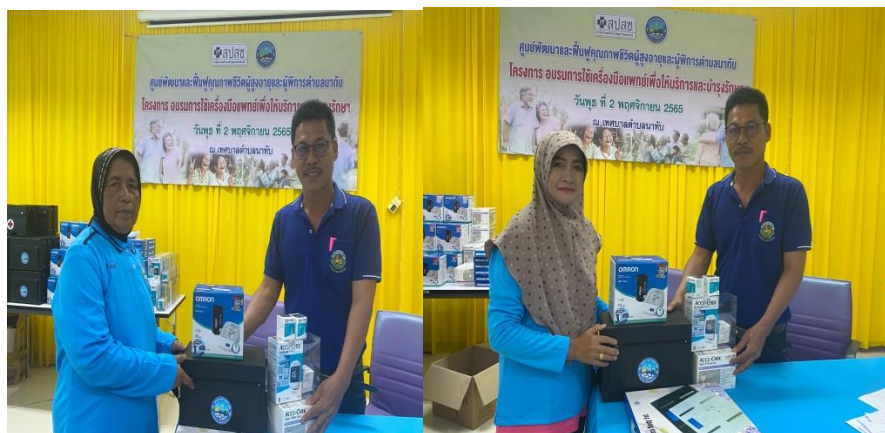
ภาพการยืมเครื่องมือแพทย์ของสมาชิก CG เพื่อไปใช้ในประกอบการทำงาน