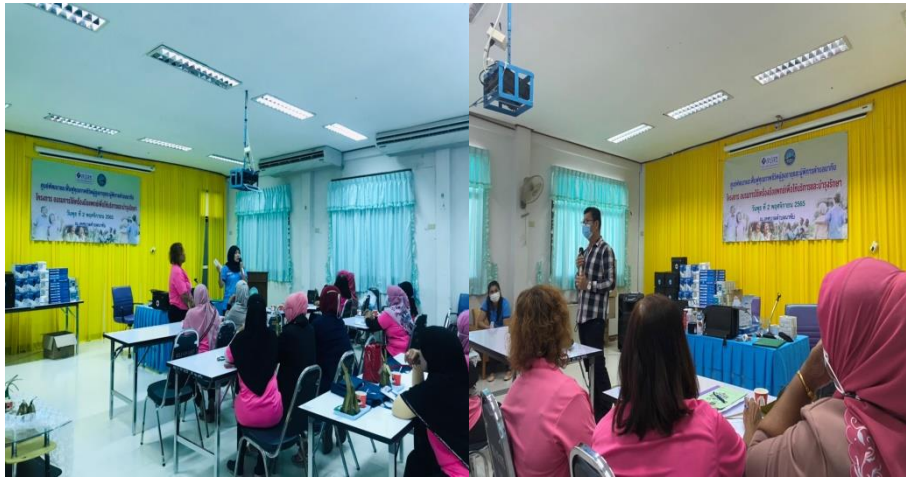
ภาพวิทยากร สอนการอบรมการใช้เครื่องมือแพทย์และการบำรุงรักษาเครื่องมือ