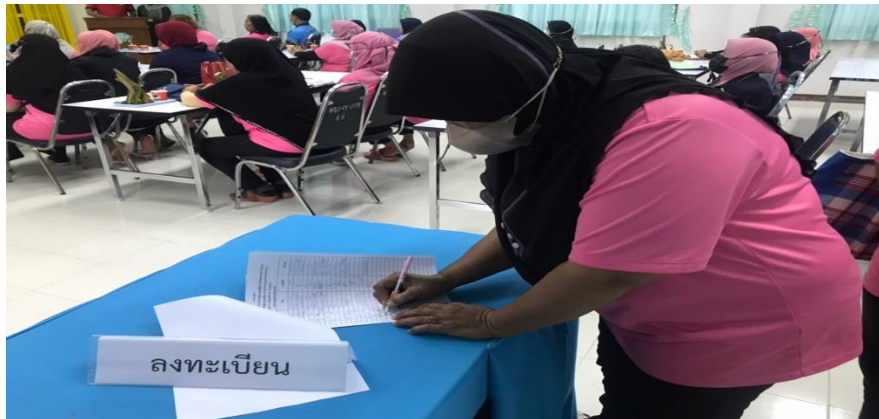
ภาพ การลงทะเบียนเข้าอบรม

ในวัน ๒ พฤศจิกายน ๒๕๖๕ ณ ห้องประชุมใหญ่เทศบาลนาทับ