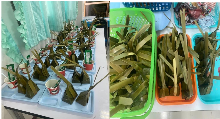
ภาพอาหารว่างและเครื่องดื่ม จำนวน 120 ชุด