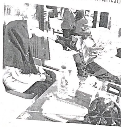
- กิจกรรมตรวจสุขภาพช่องปากนักเรียน