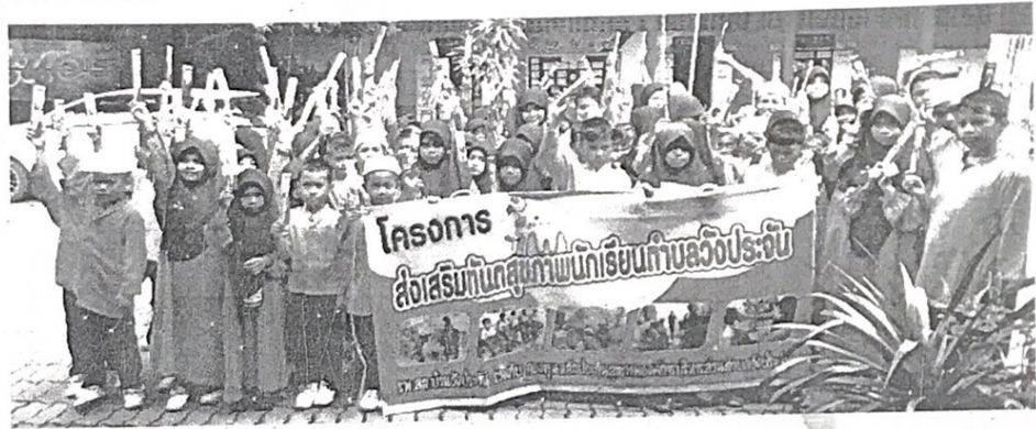
กิจกรรมให้บริการทัศนศึกษานักเรียน