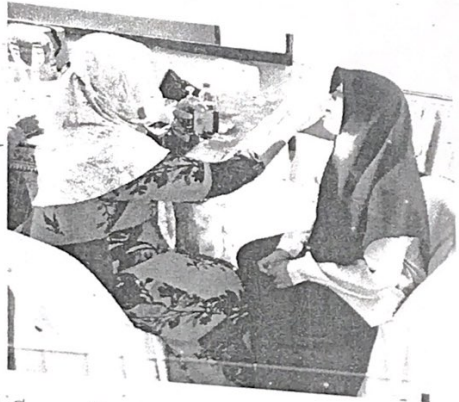
กิจกรรมเสวนาให้ความรู้ทันตสุขภาพนักเรียนและฝึกทักษะการแปร่งฟันที่ถูกต้อง